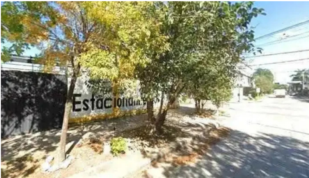
Credito azteca srl promocion