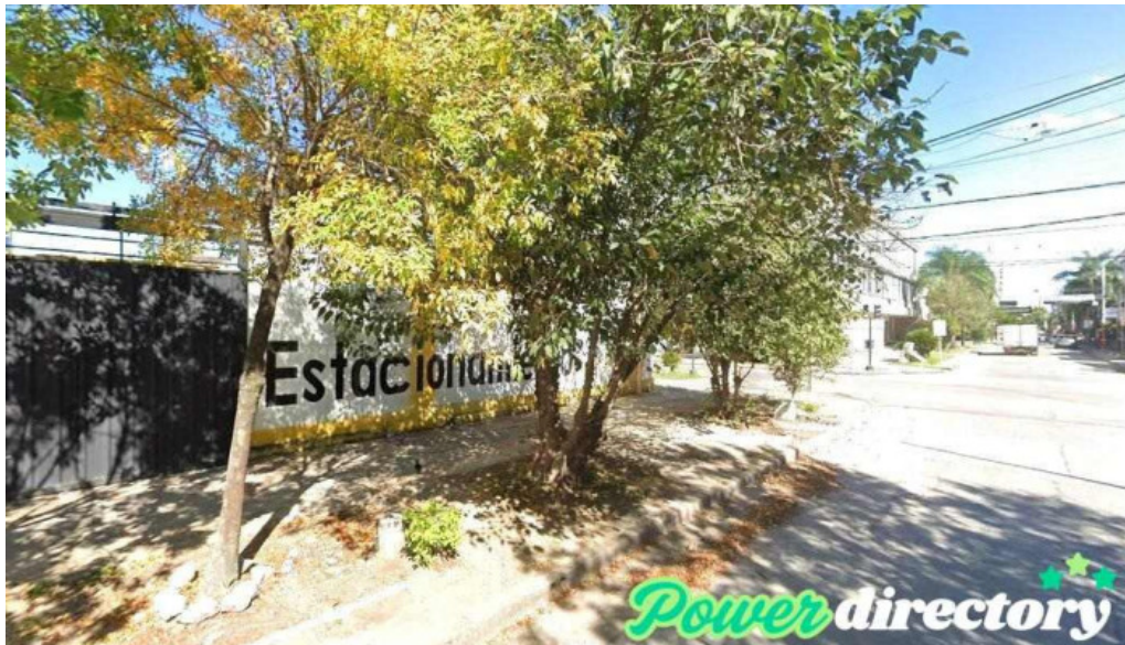
Credito azteca s r l resistencia