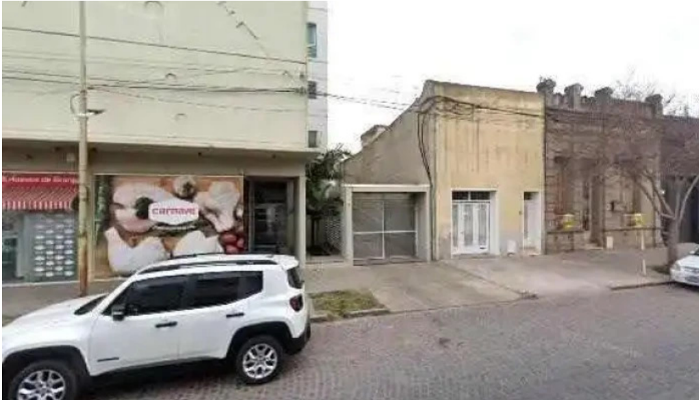
Aequitas sa comentarios