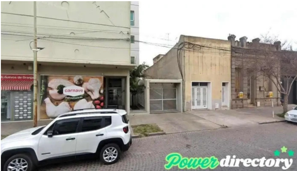
Aequitas s a rafaela