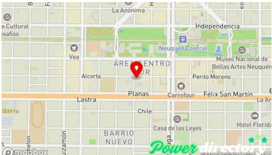
Dinero full mapa