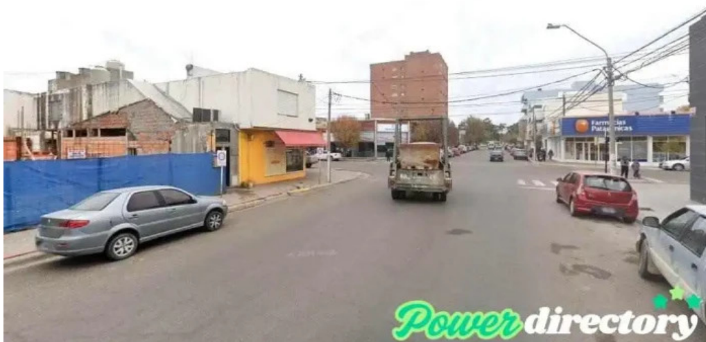
Carta automatica puerto madryn