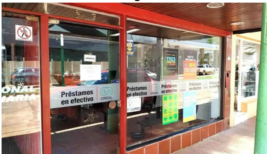
Credil puerto iguazu