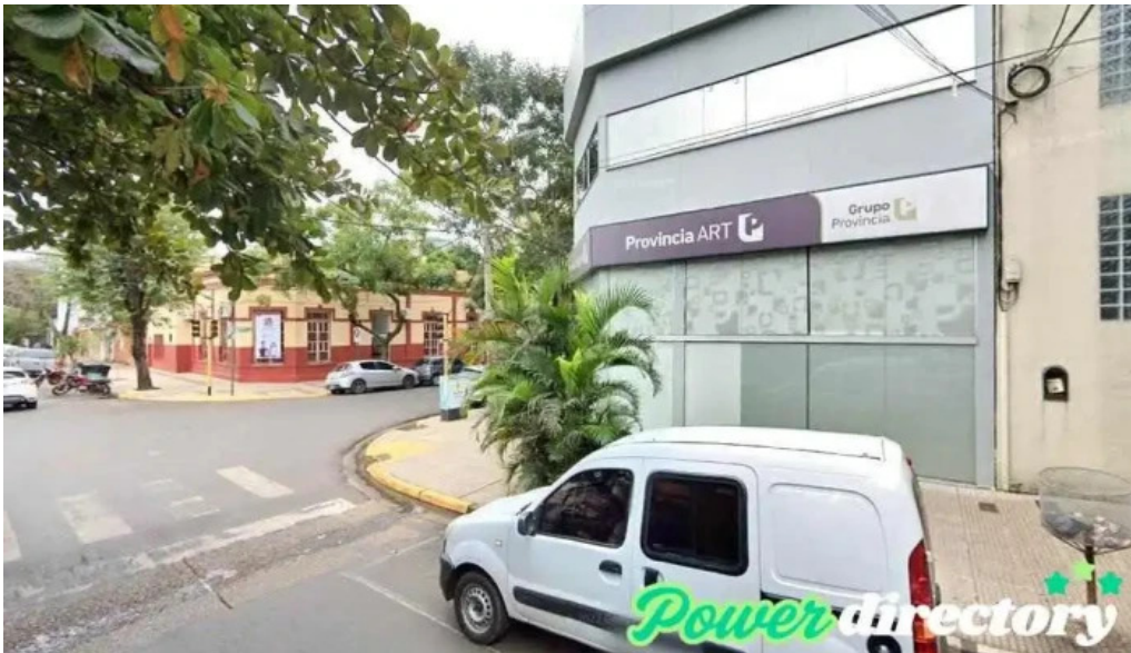
Prestamos personales posadas