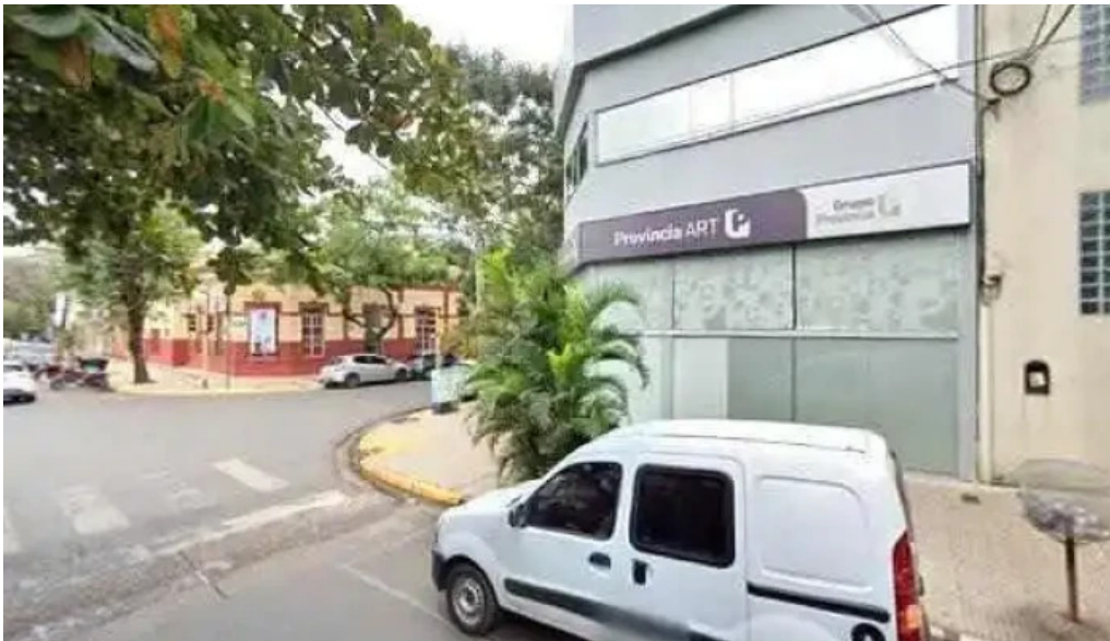
Prestamos personales numero