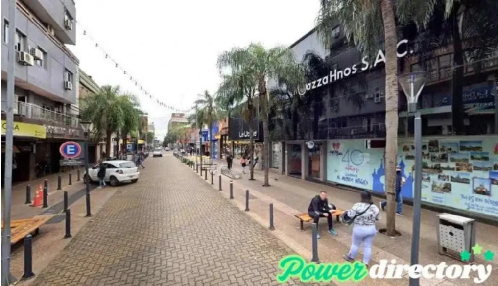
Prestamos personales con o sin veraz posadas