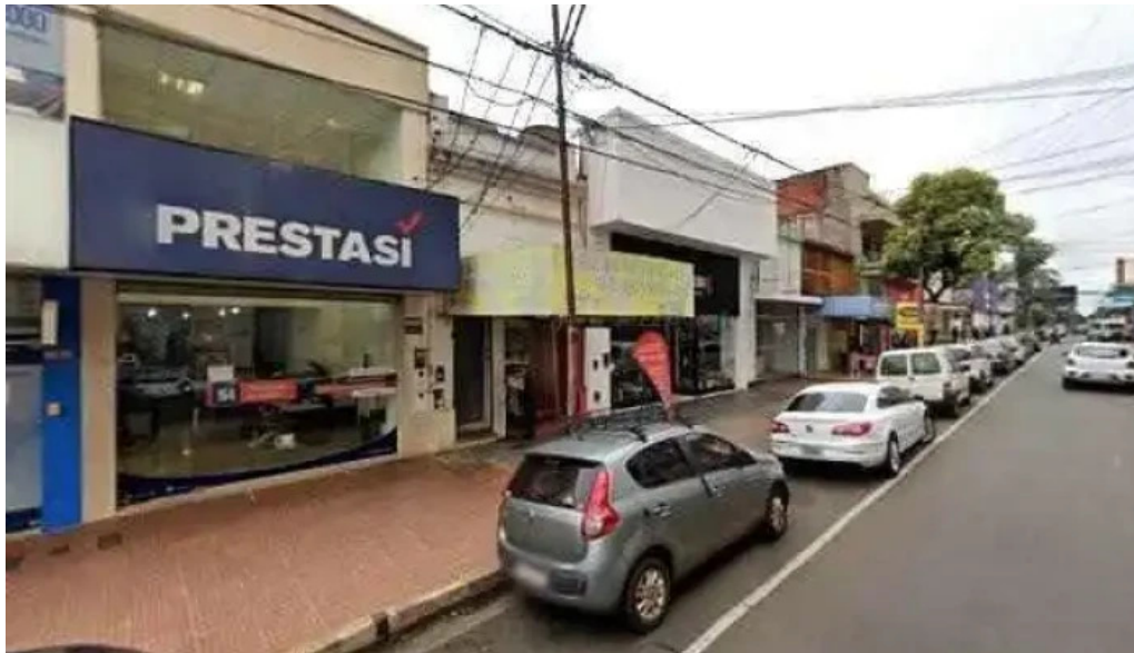
Garantizar no es casa de cambio comentarios