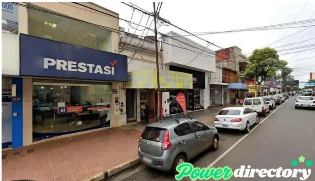
Garantizar **no es casa de cambio** posadas