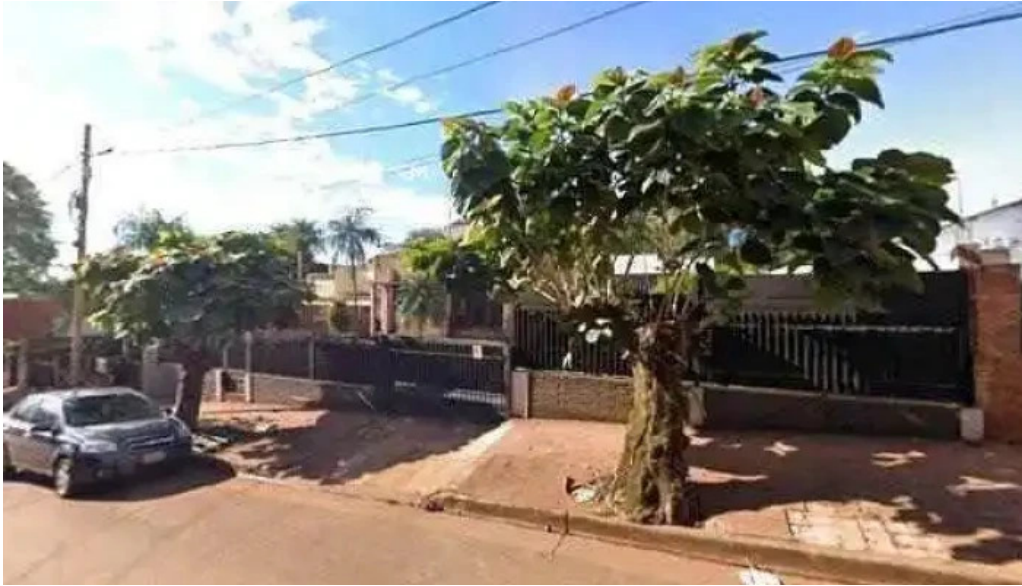
Microfin prestamos ubicacion