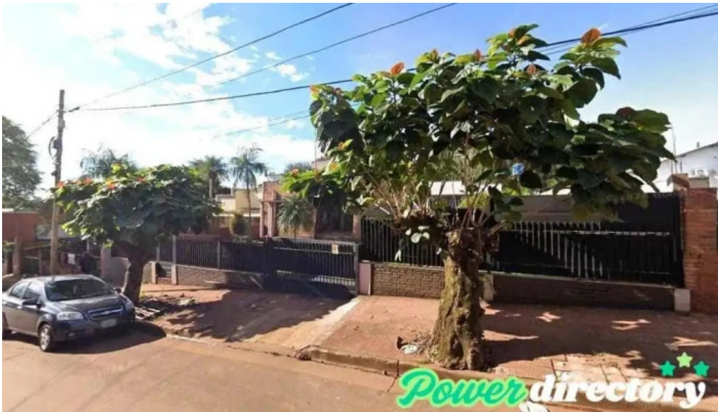
Microfin prestamos obra