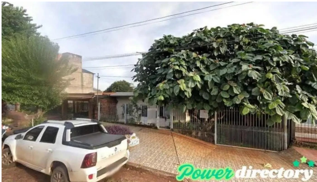
Credisi srl obra