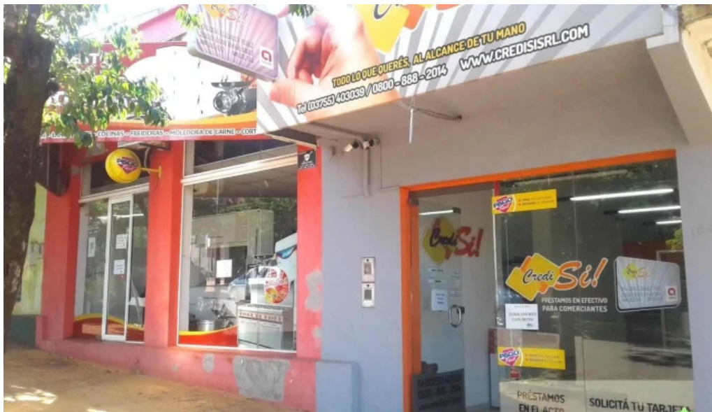
Credisi srl exterior