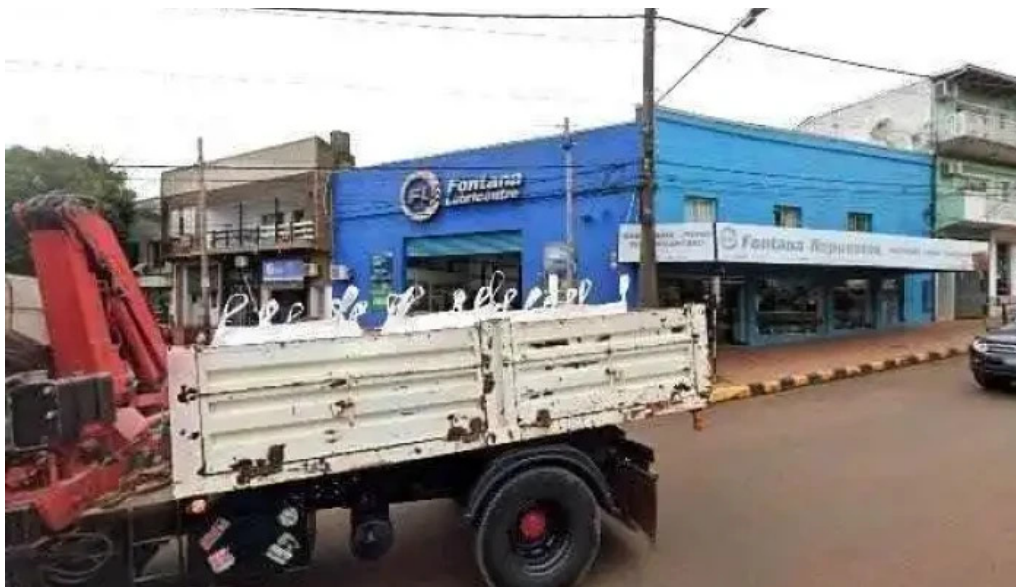
Credisi srl como llegar