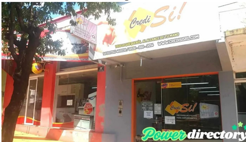
Credisi srl obera