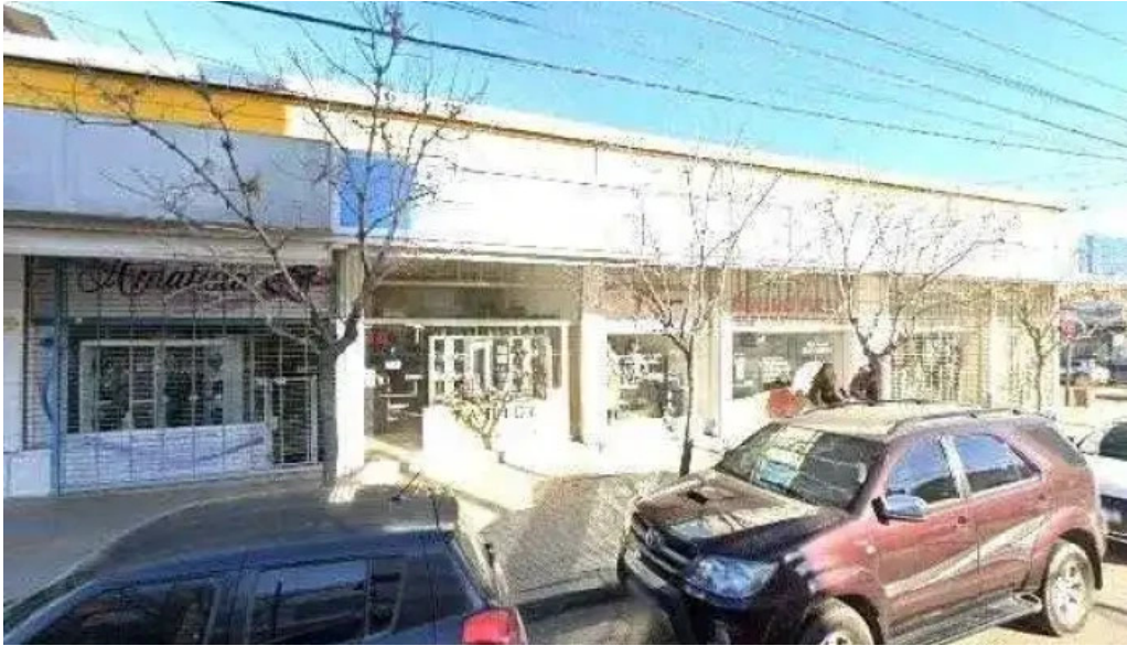
Credipago sitio web