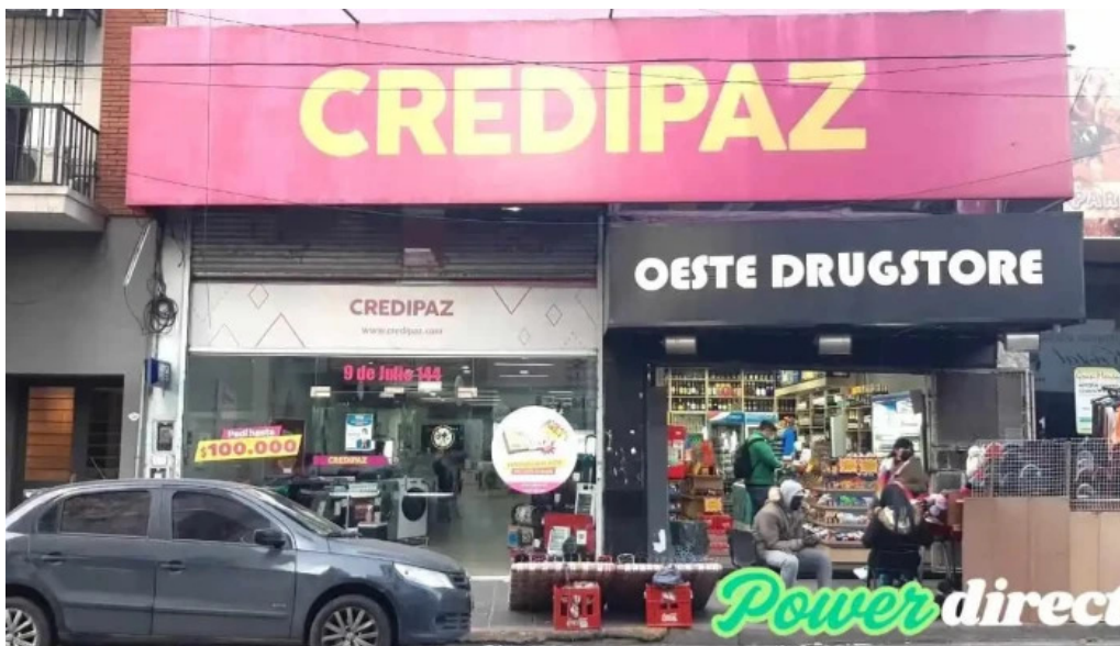
Credipaz del propietario