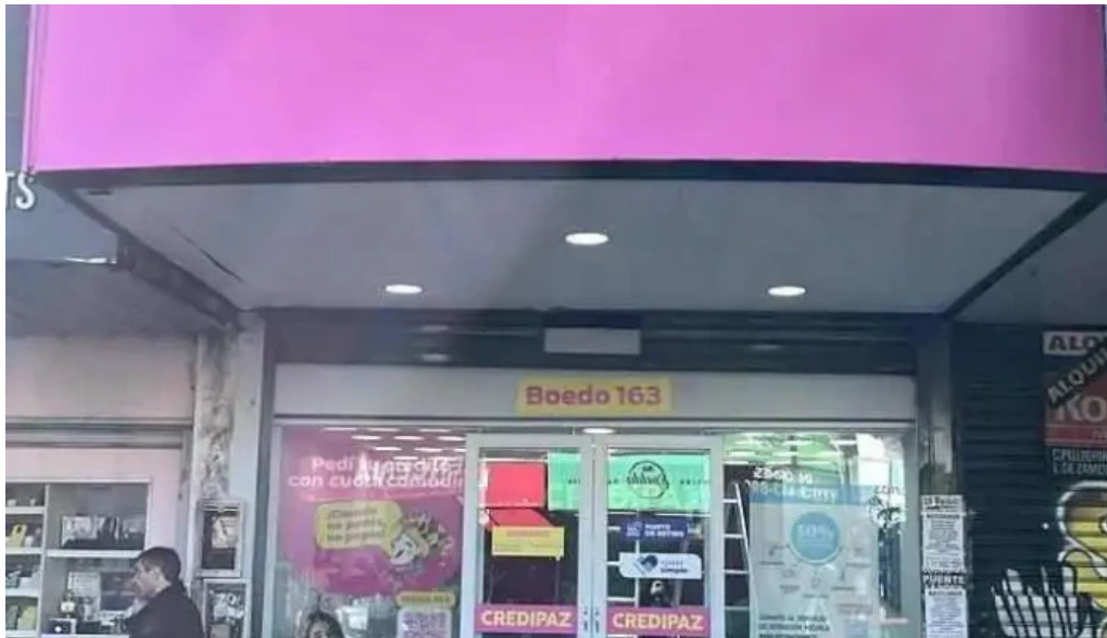
Credipaz sitio web