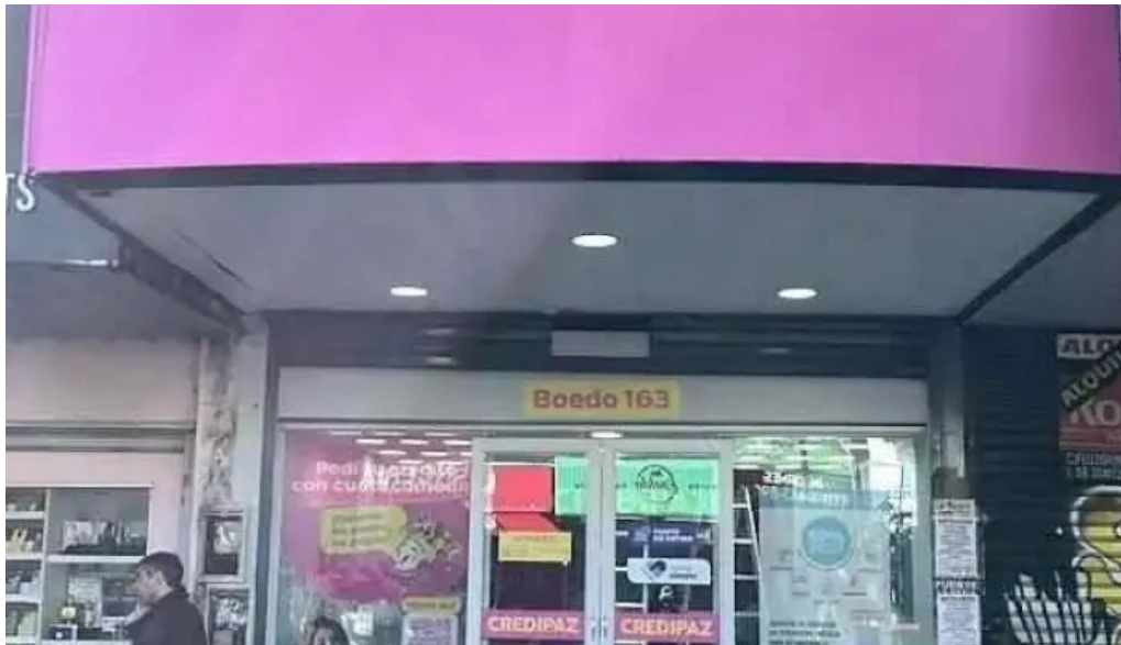
Credipaz lomas de zamora