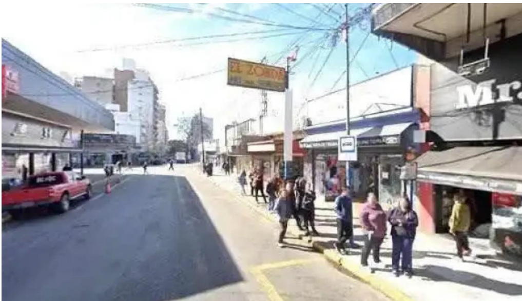
Credipaz sitio webdeg