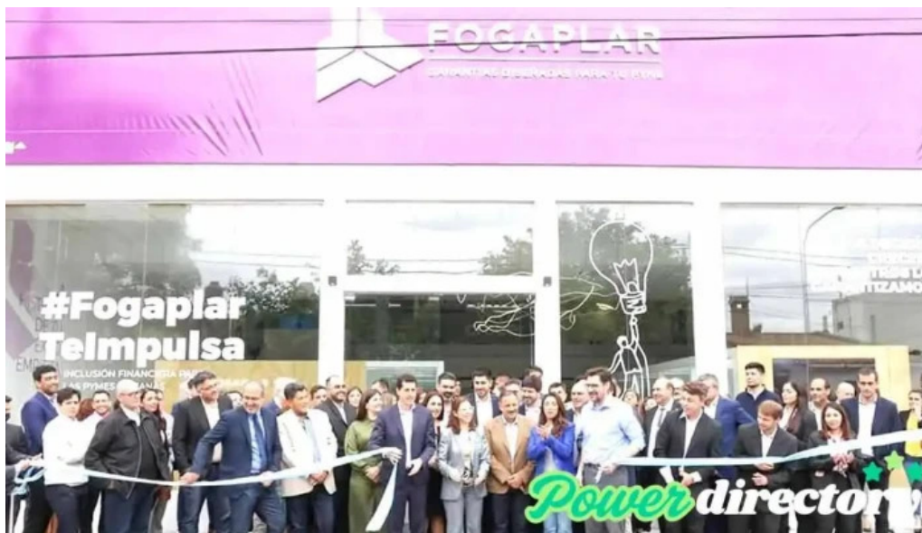
Fogaplar fondo de garantías de la rioja la rioja