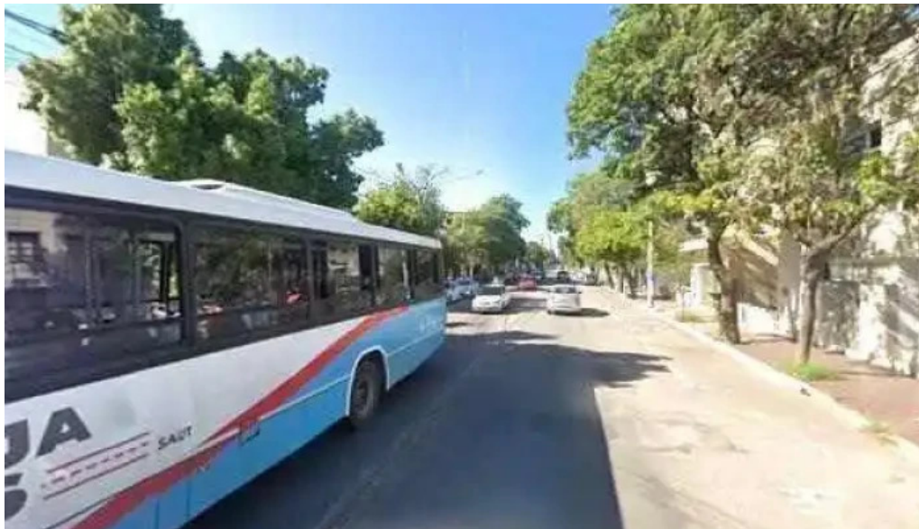
Fogaplar fondo de garantías de la rioja comentarios