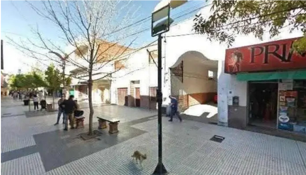
Credil prestamos en efectivo puntaje