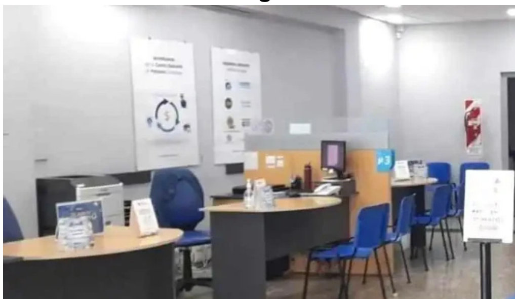
Credito argentino mas recientes