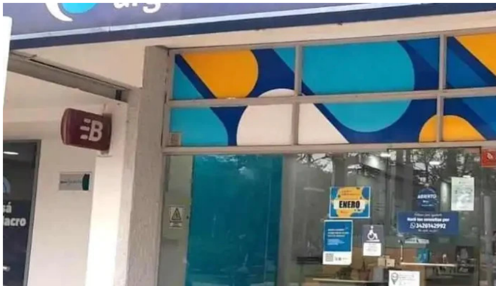
Credito argentino jesus maria