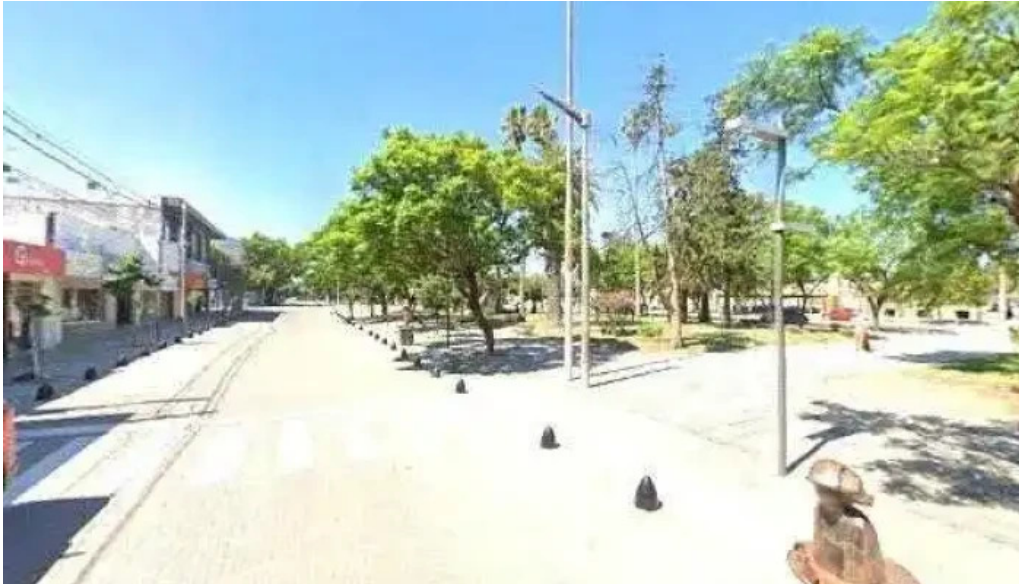
Credito argentino comentariosdeg