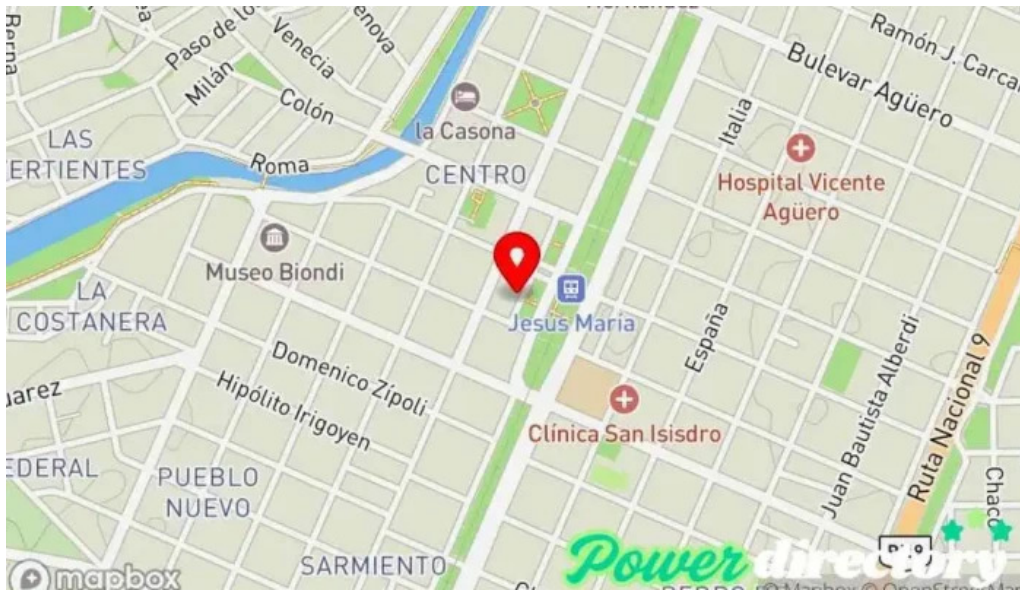
Credito argentino mapa