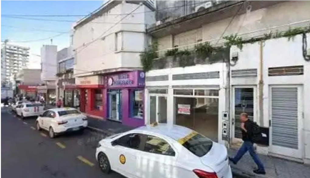
Dinero full cerca de mi