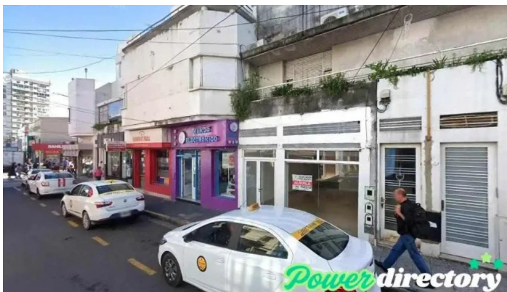
Dinero full hna