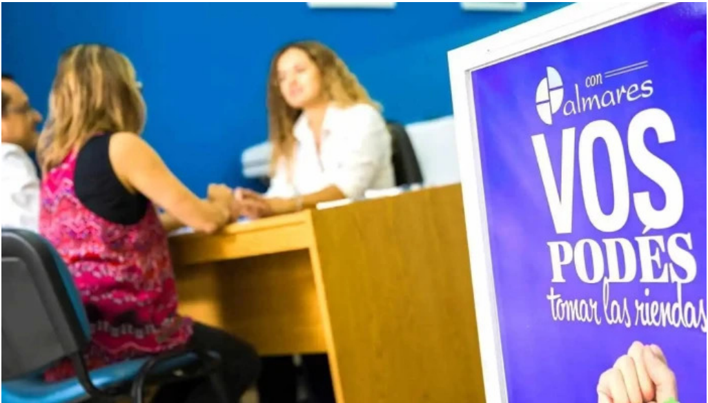
Palmares efectivo en el acto gualeguaychu