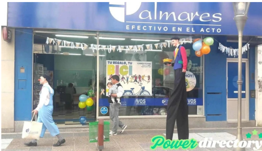
Palmares efectivo en el acto exterior