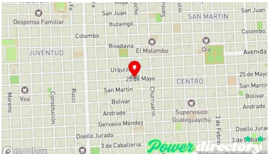
Palmares efectivo en el acto mapa