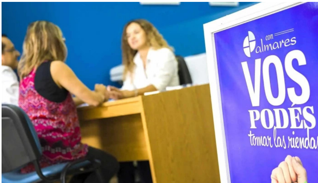
Palmares efectivo en el acto instagram