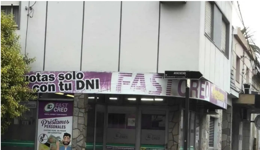
Fastcred franquicia gualaguaychu abierto ahora