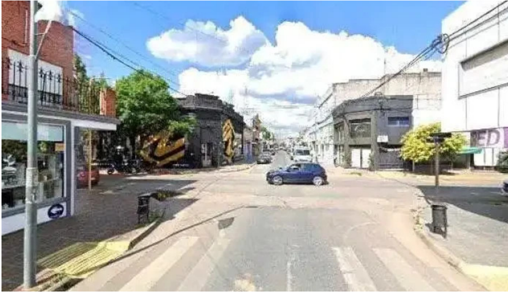
Fastcred franquicia gualaguaychu abierto ahoradeg