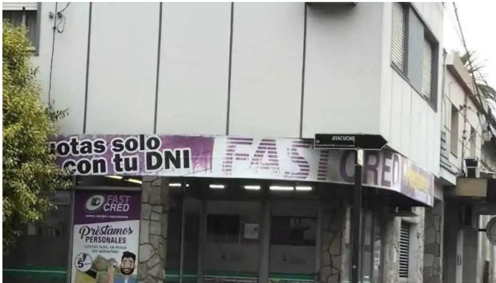
Fastcred franquicia gualeguaychu gualeguaychu