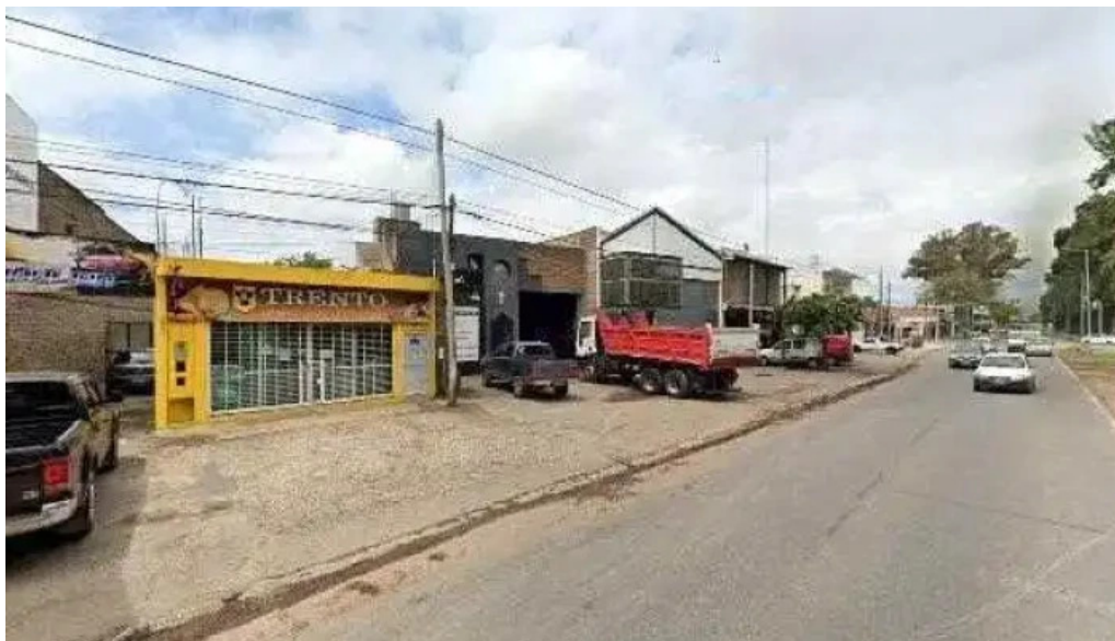
Mutual villa el prado abierto ahora