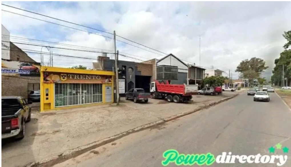
Mutual villa el prado granadero baigorria