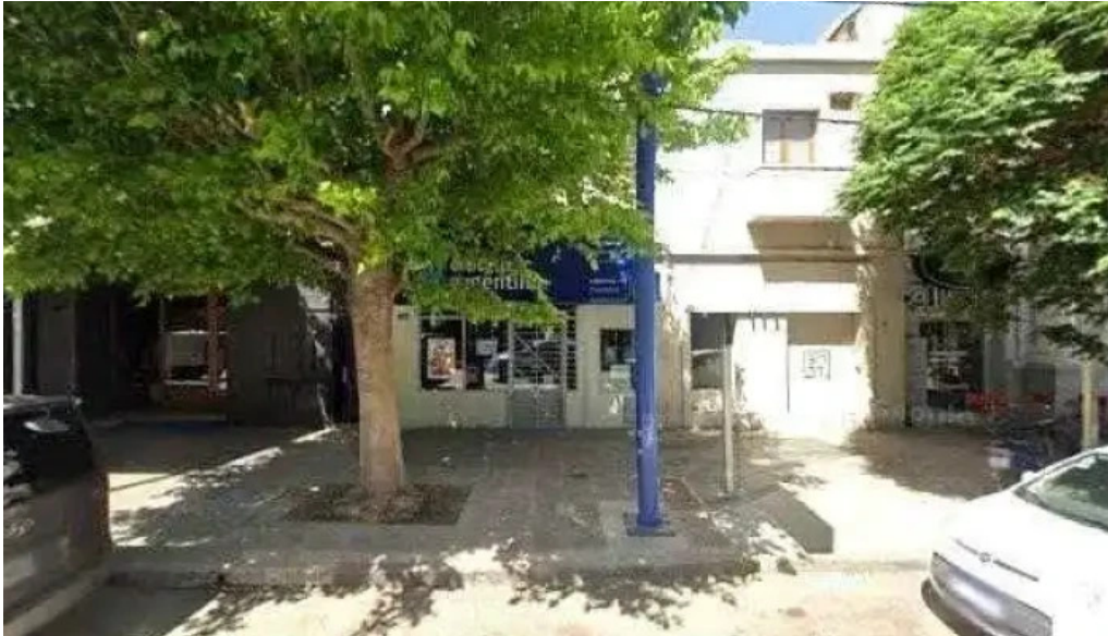
Credito argentino numero