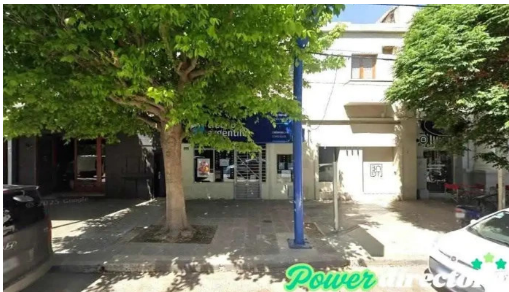
Credito argentino gral roca