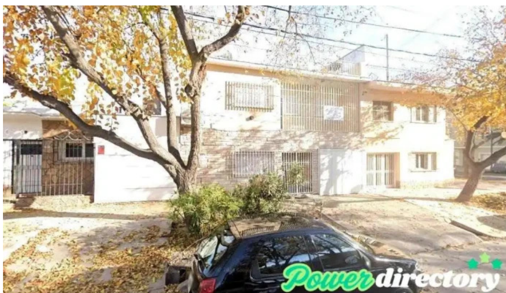
Prestamos sa godoy cruz