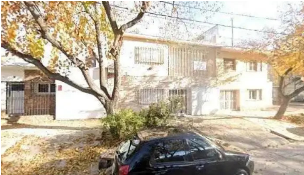
Prestamos sa promocion