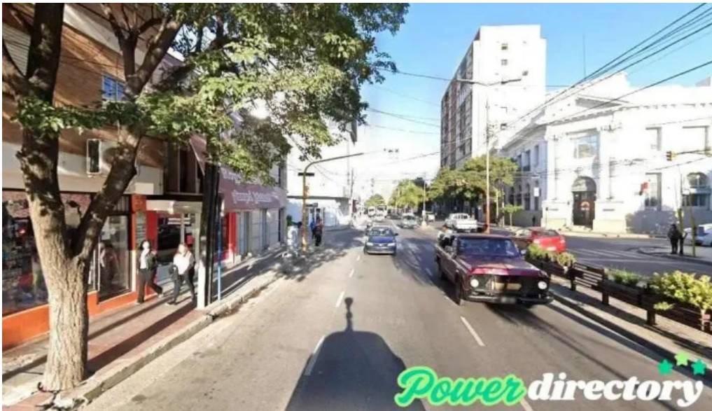
Ahora si creditos g4200hxp