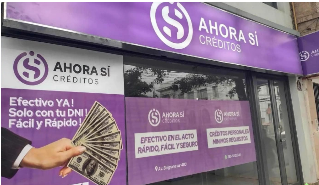
Ahora si creditos exterior