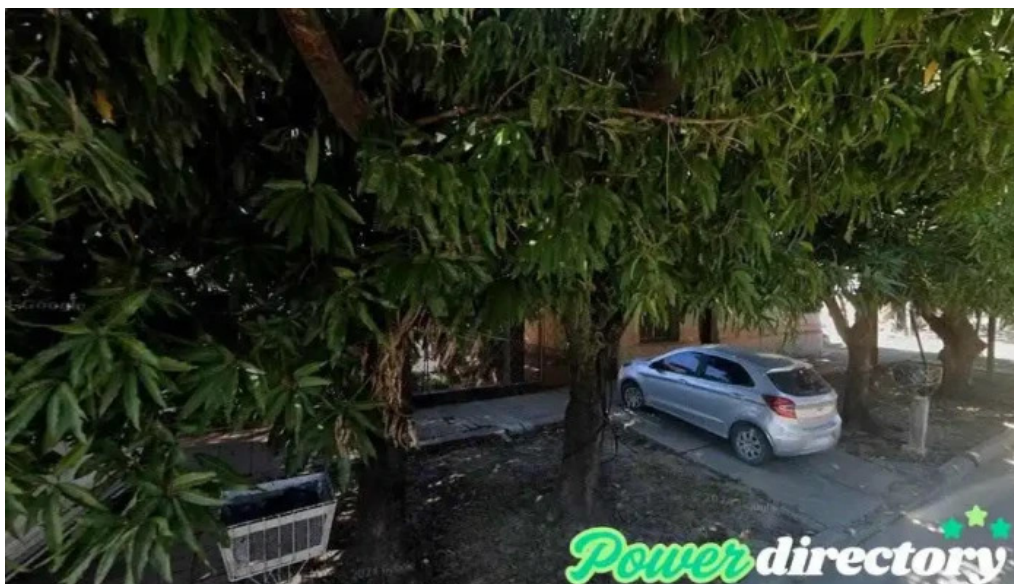
Creditos hoy formosa