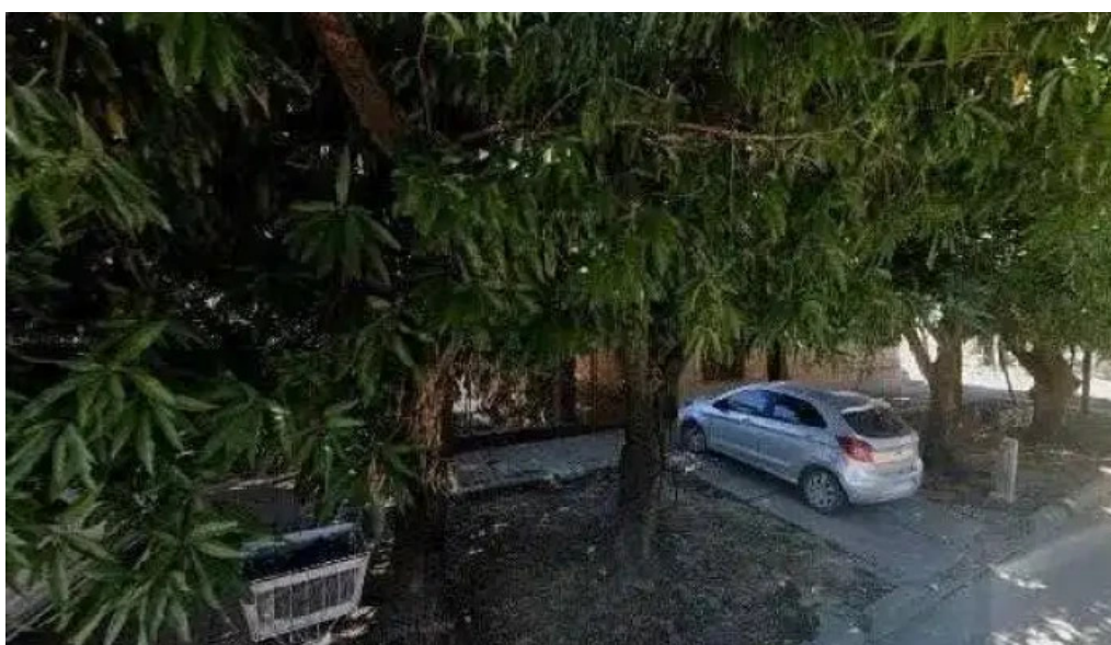
Creditos hoy comentarios