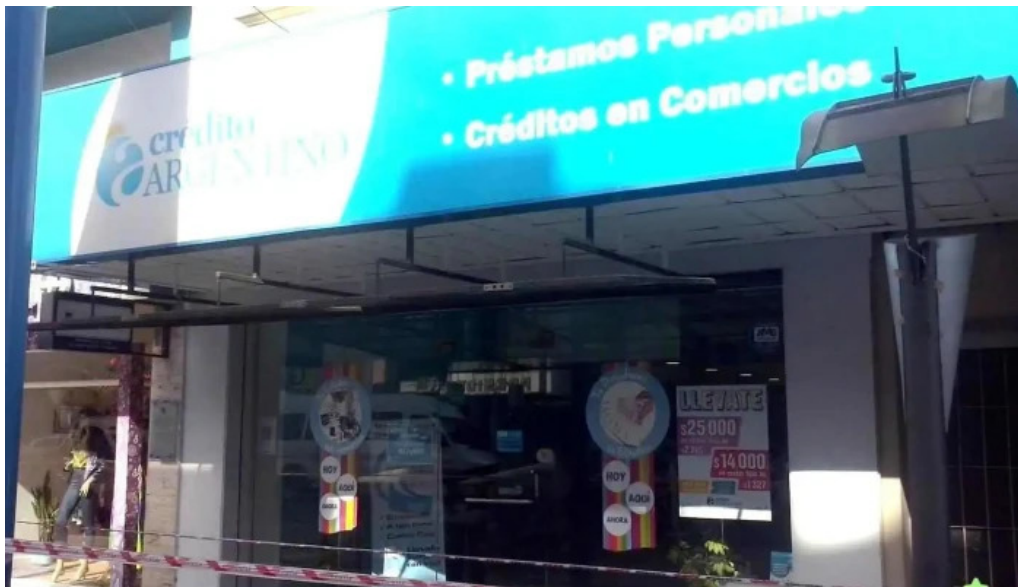
Credito argentino fnd