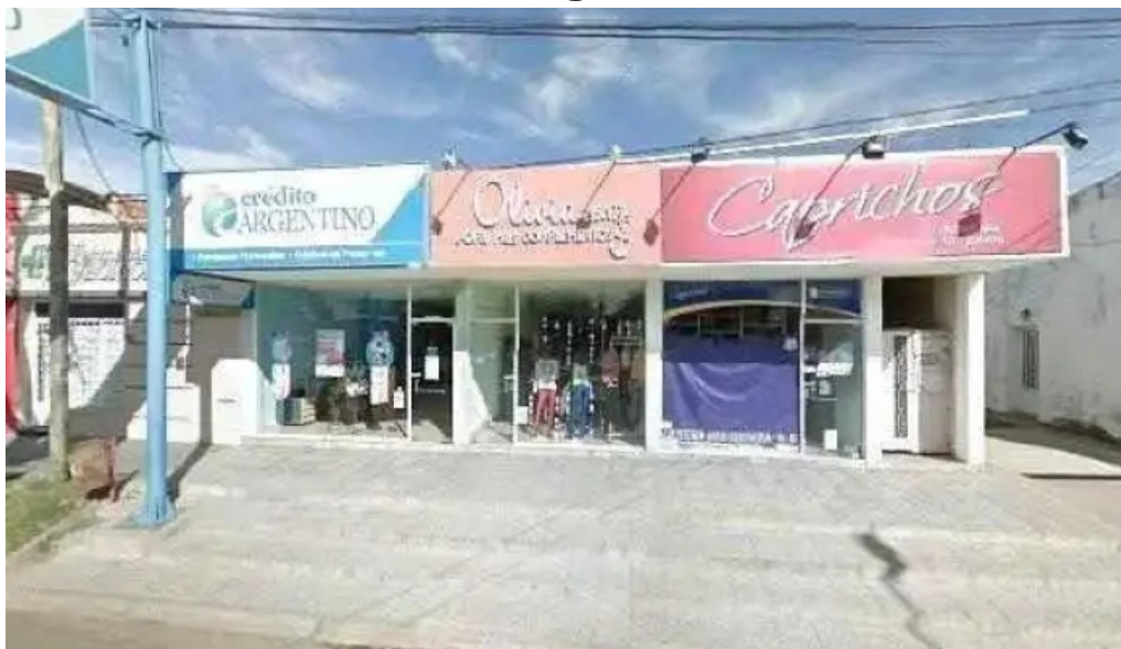
Crédito argentino telefono