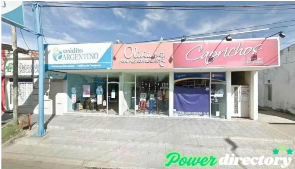
Credito argentino federal