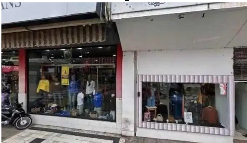
Credito argentino ubicacion