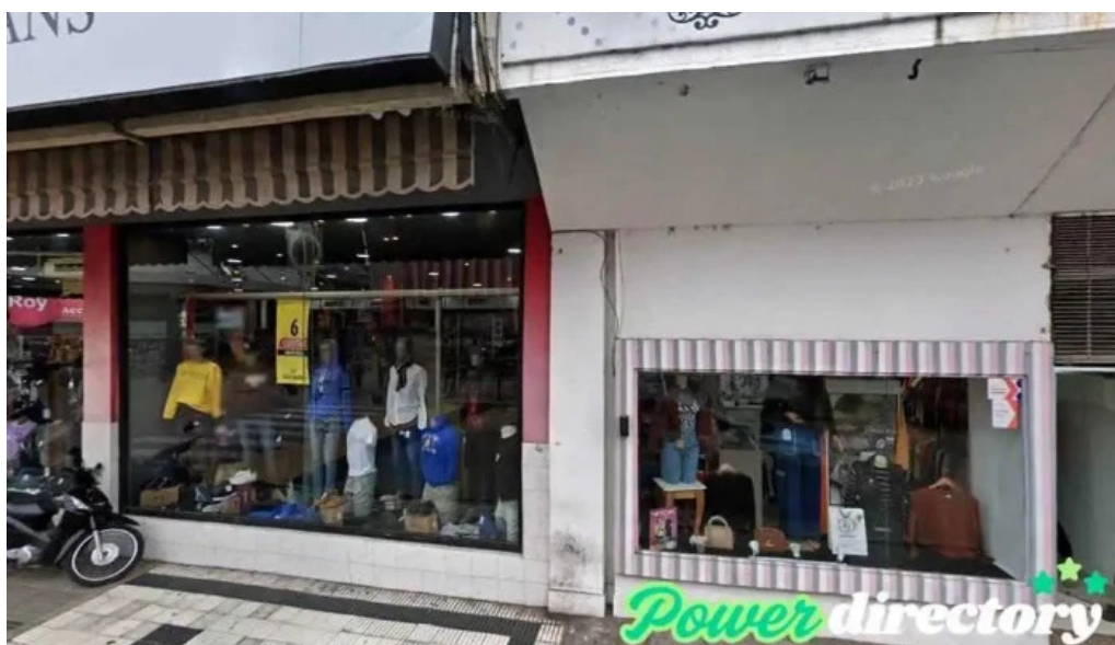
Credito argentino faa