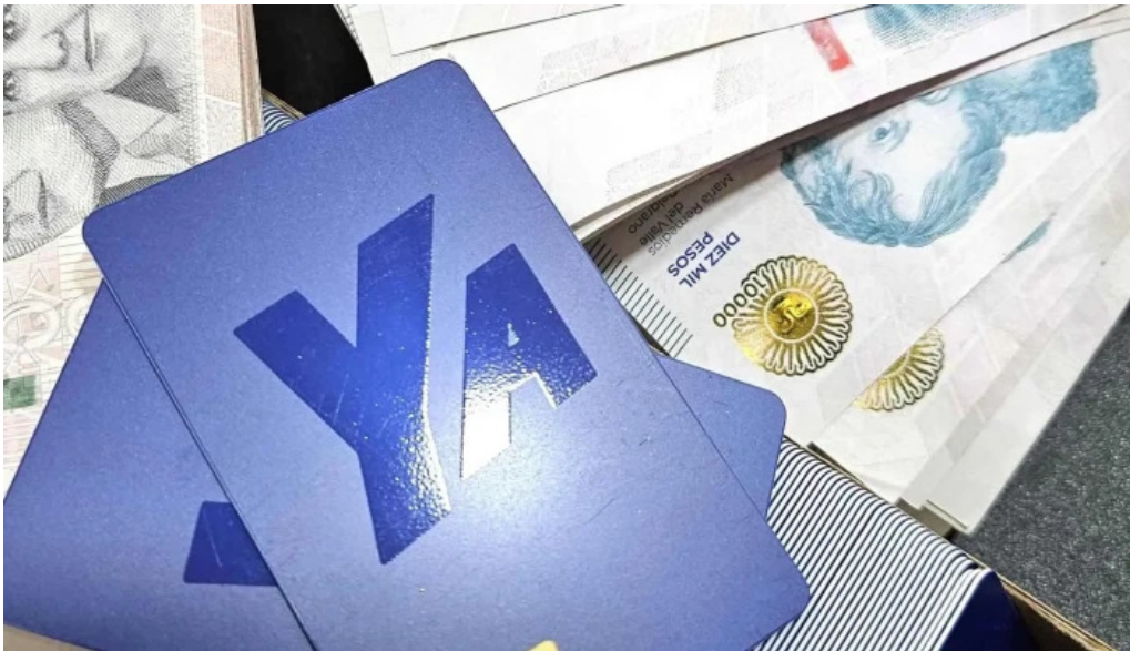
Finanya del propietario