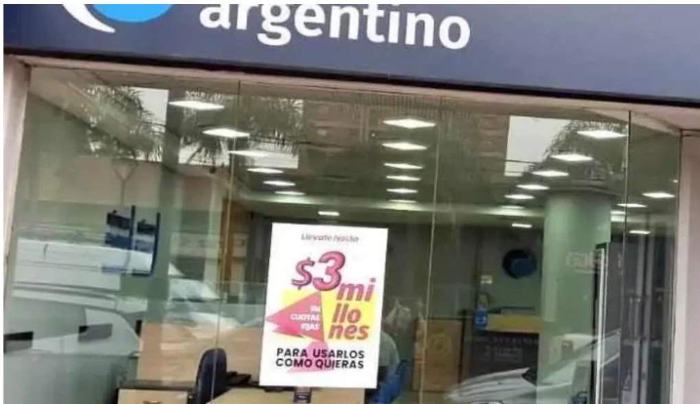
Credito argentino mas recientes