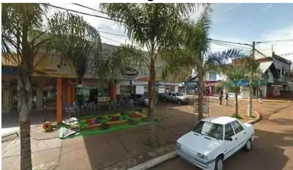
Credito argentino videosdeg