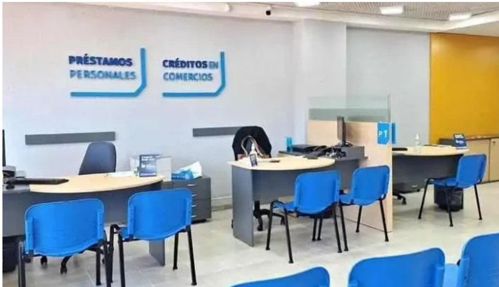
Credito argentino videos