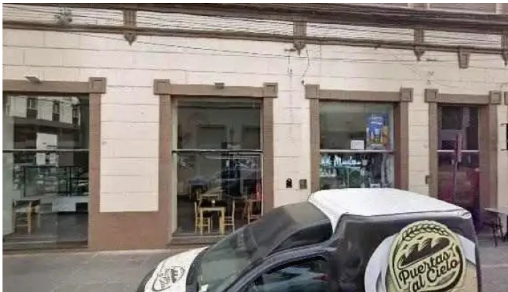
Solventa prestamos personales cerca de mi