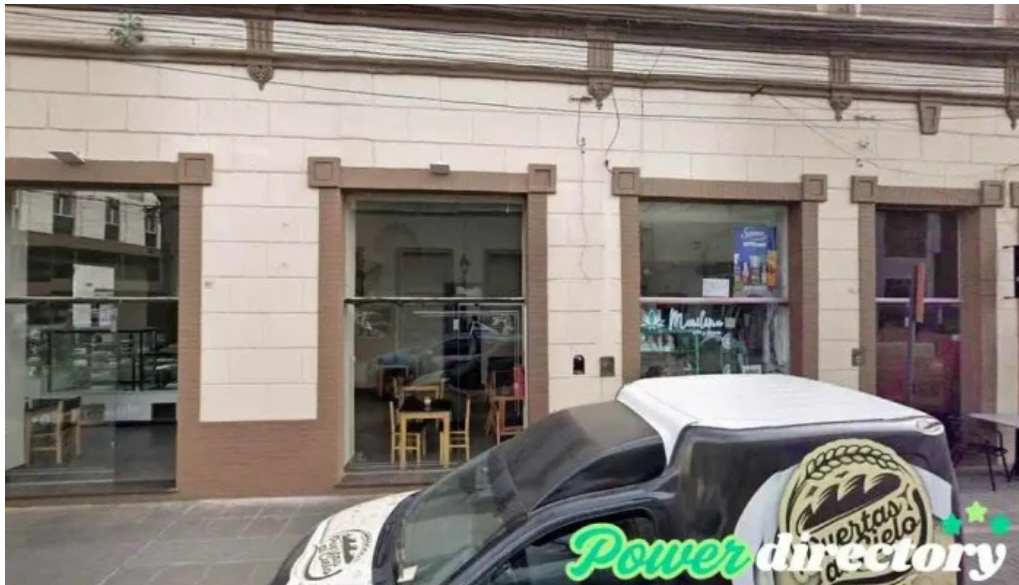
Solventa prestamos personales dmq