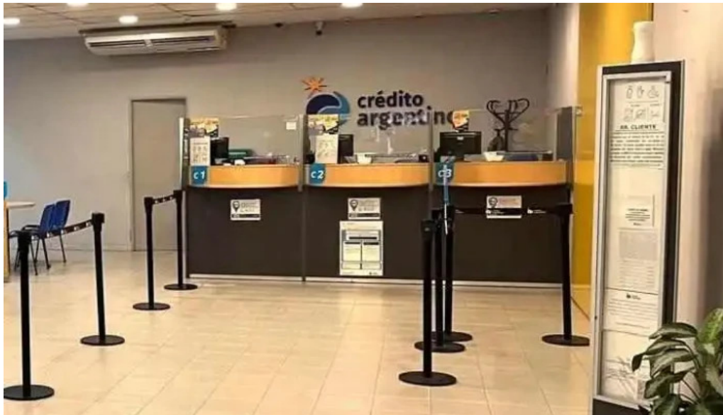
Credito argentino dlh