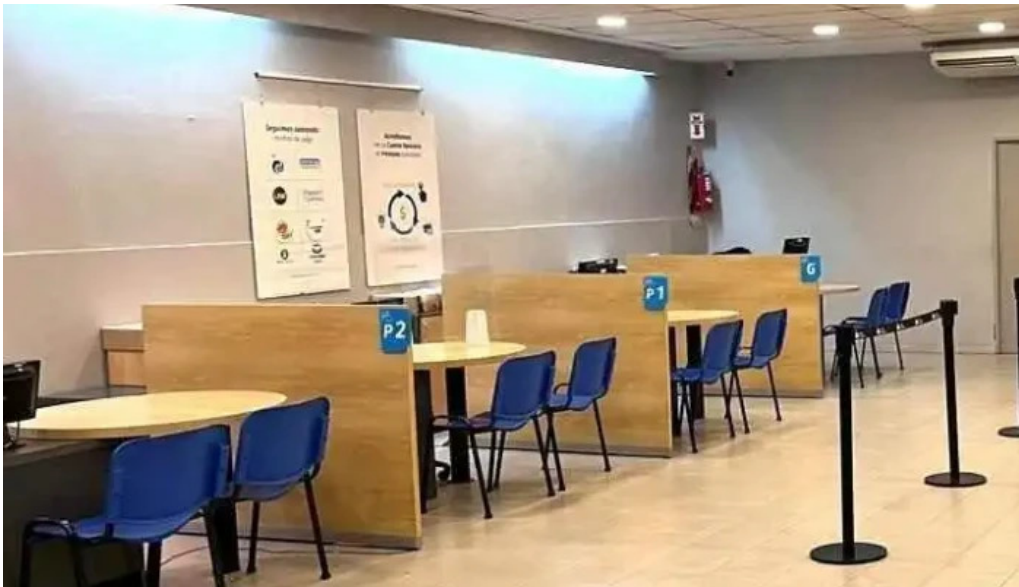
Credito argentino interior