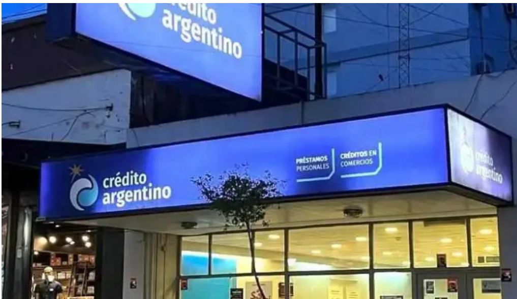
Crédito argentino exterior