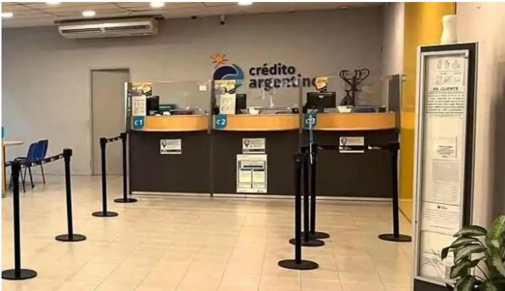
Crédito argentino instagram