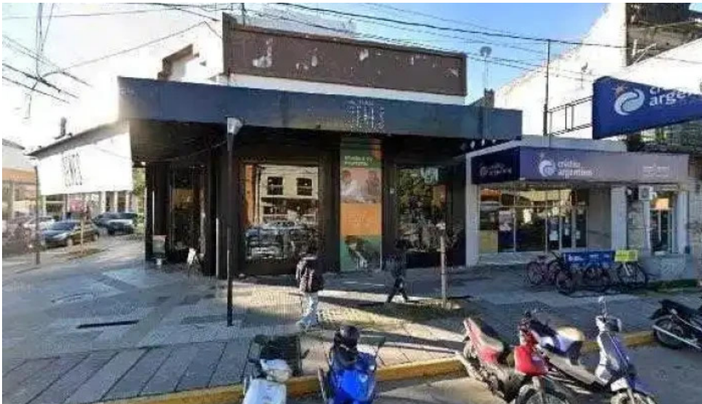
Credito argentino instagramdeg