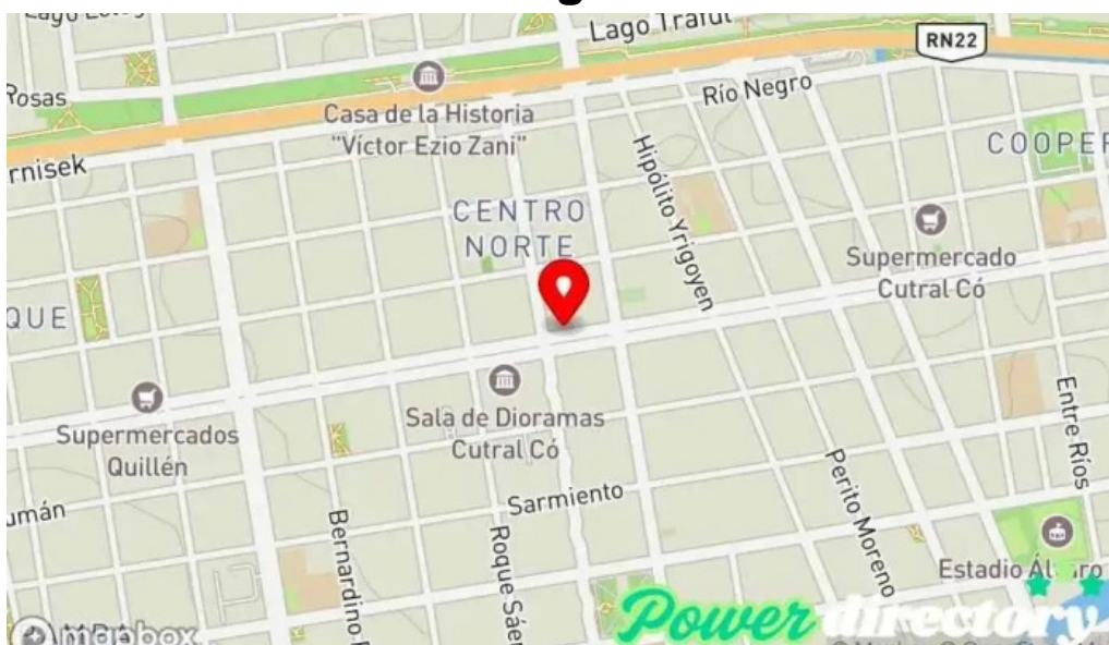
Carta automatica mapa