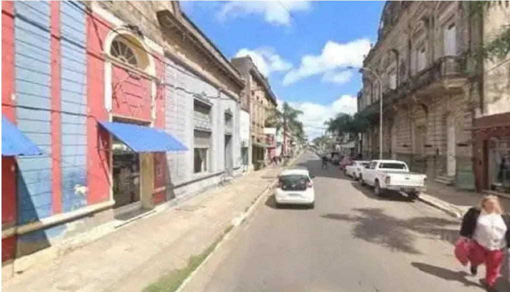
Credito argentino catalogodeg