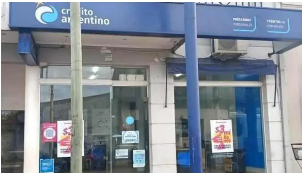
Credito argentino catalogo