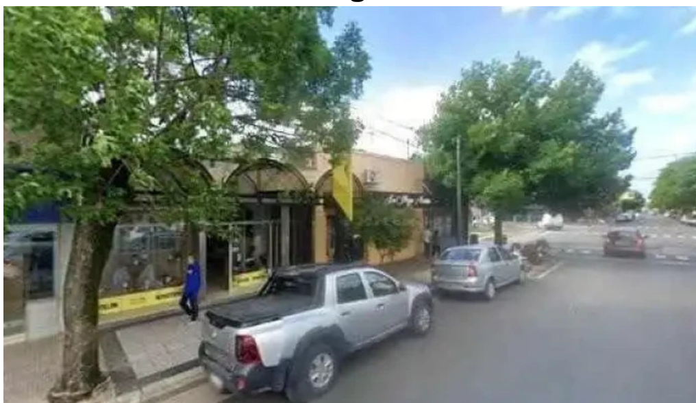
Credito argentino sitio web