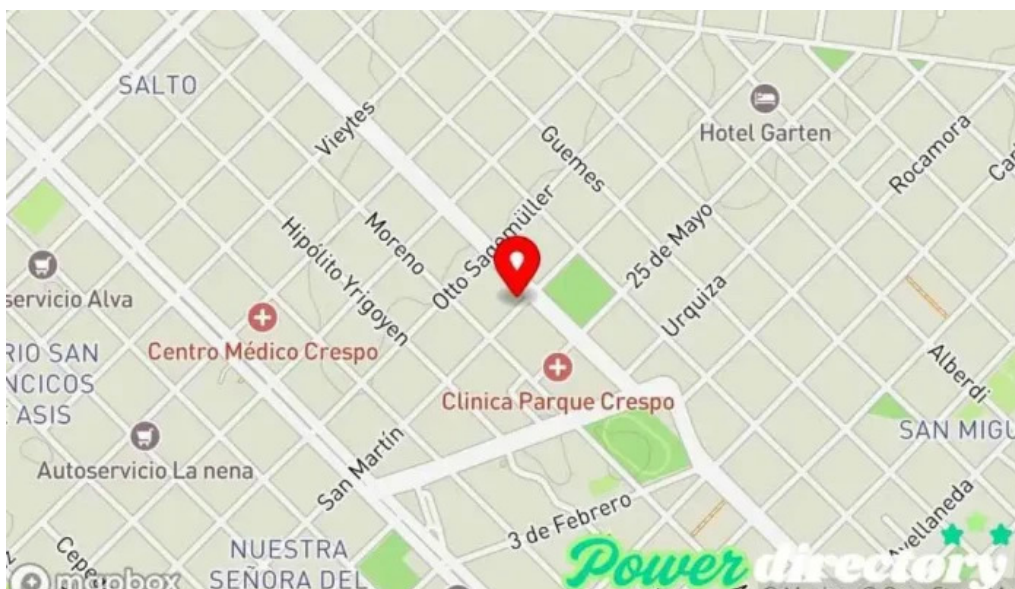
Credito argentino mapa