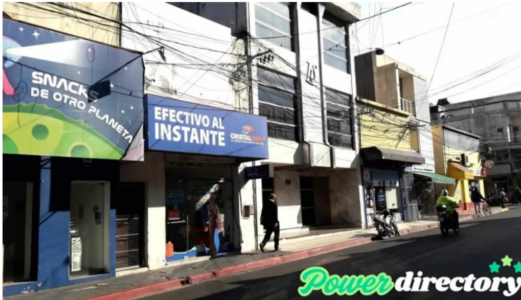
Cristal cash exterior