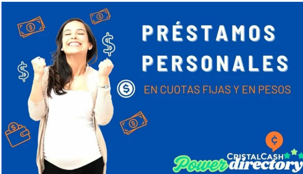
Cristal cash del propietario