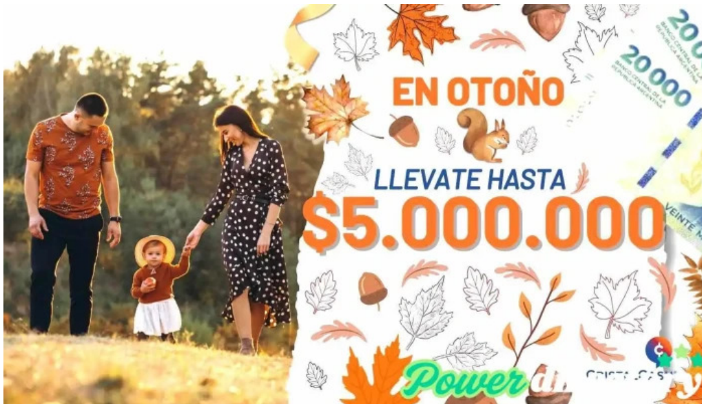
Cristal cash corrientes