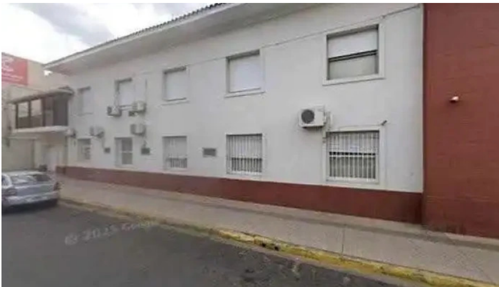
Cristal cash zonadeg