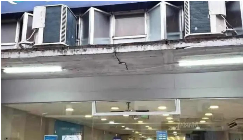
Credito argentino mas recientes