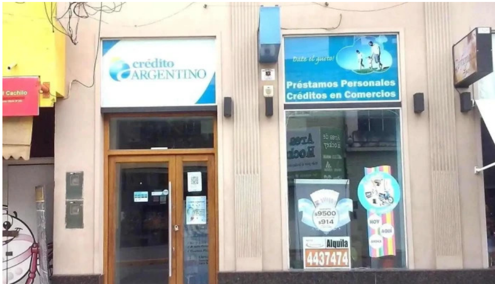
Credito argentino exterior