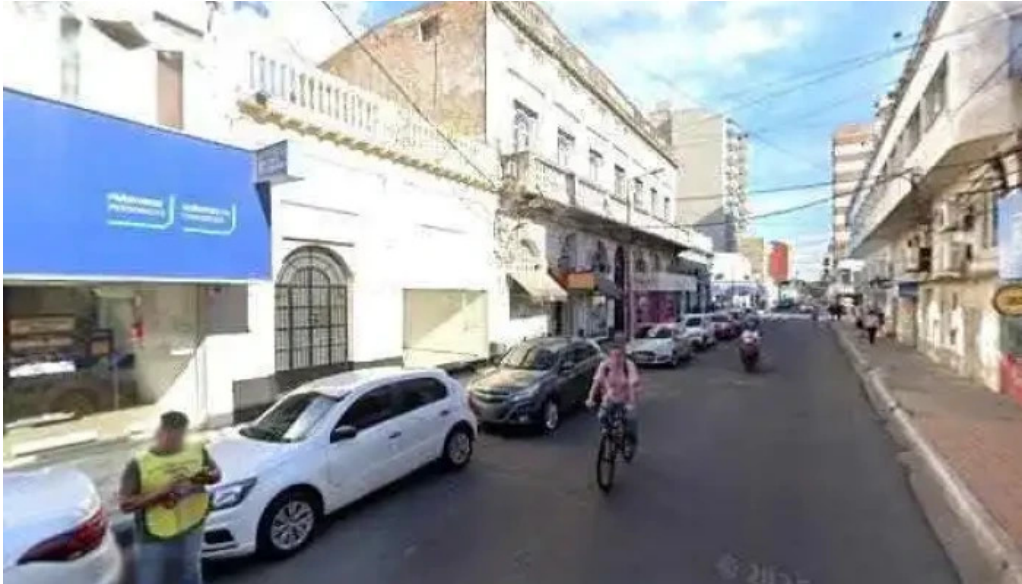
Credito argentino numerodeg