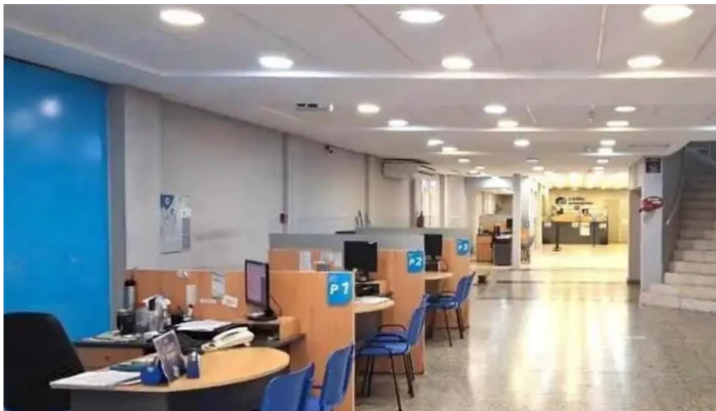
Credito argentino corrientes