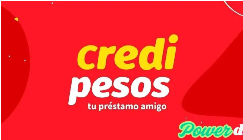
Credipesos del propietario