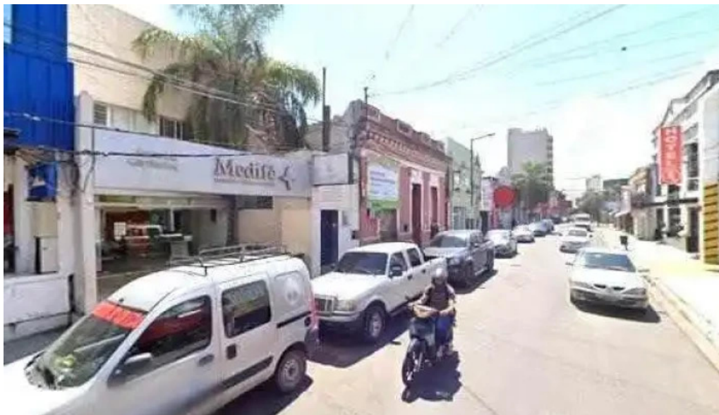
Credipesos abierto ahoradeg