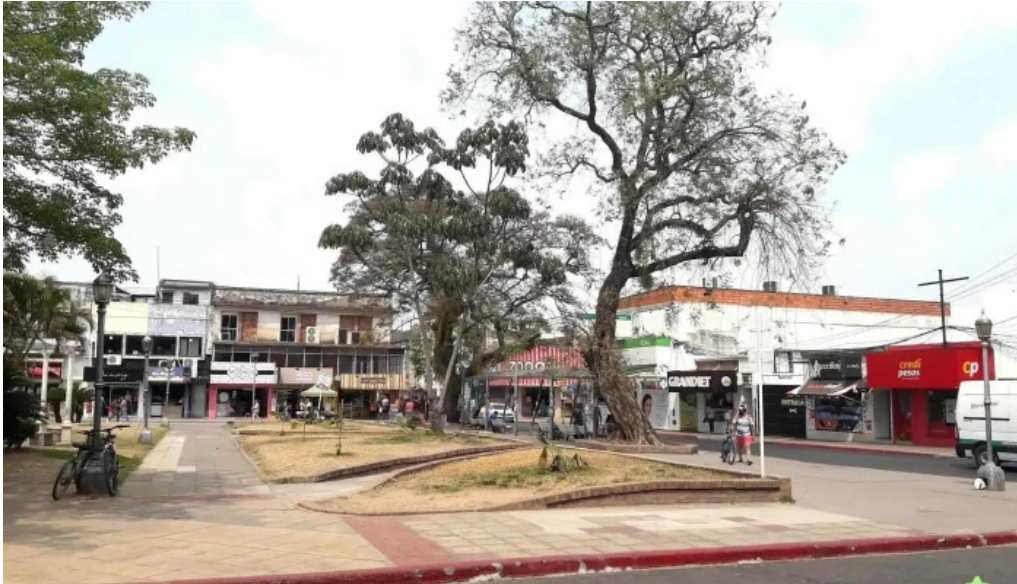
Credipesos abierto ahora