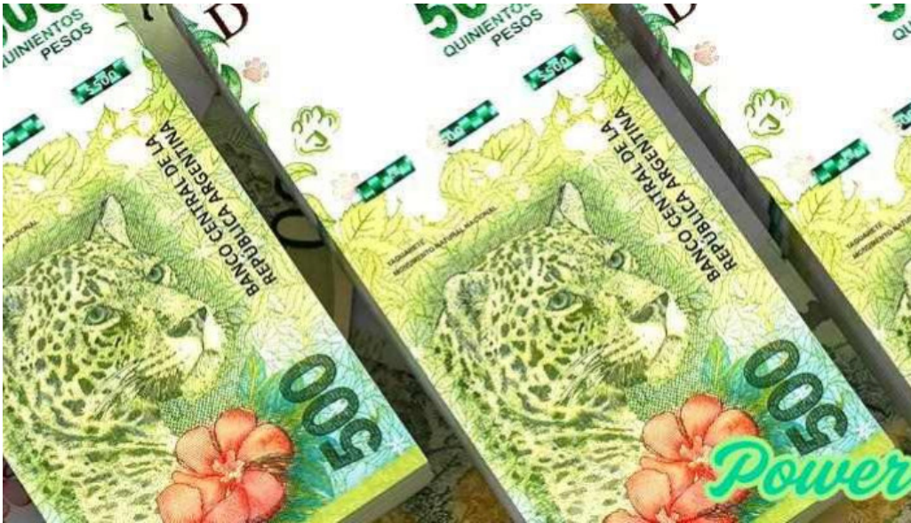
Credil del propietario