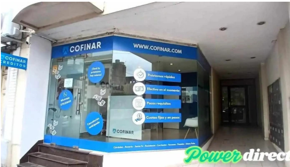
Cofinar prestamos sitio web