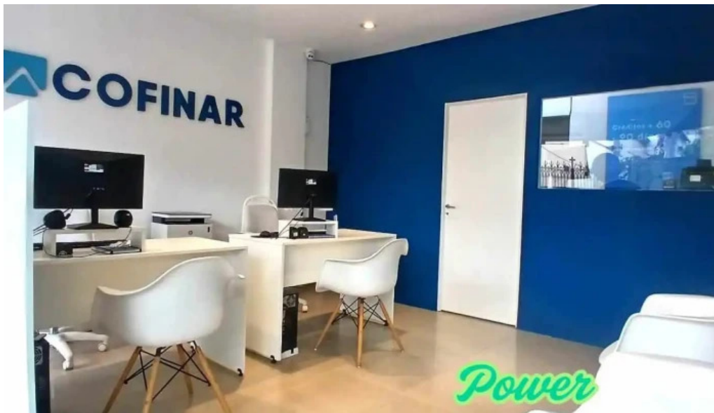
Cofinar prestamos del propietario