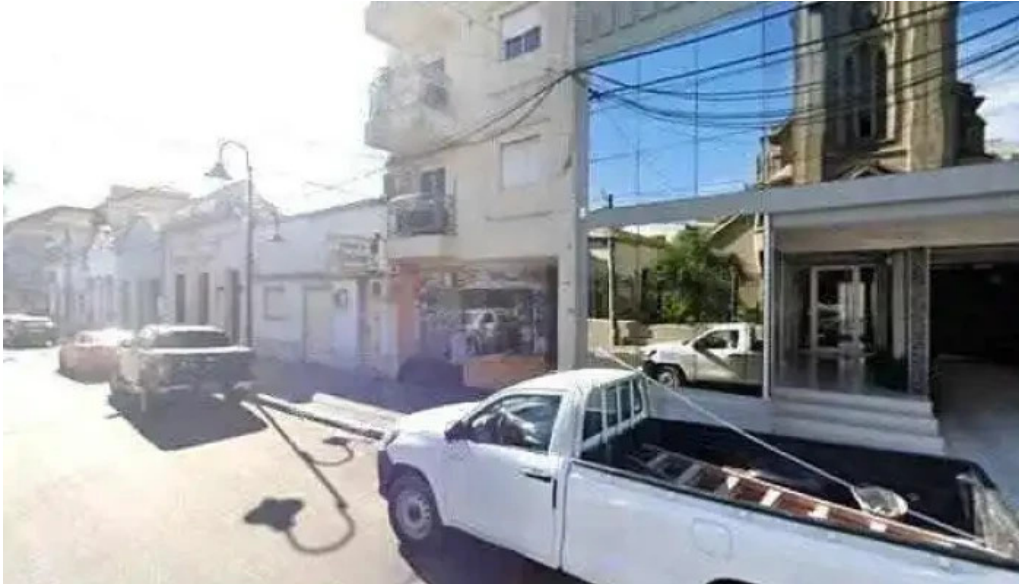
Cofinar prestamos sitio webdeg