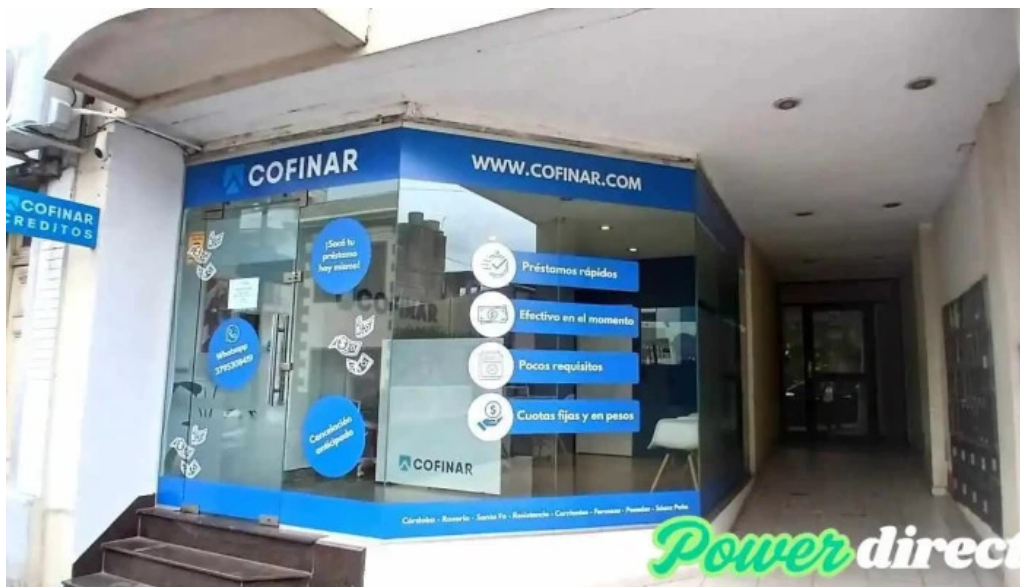
Cofinar prestamos corrientes