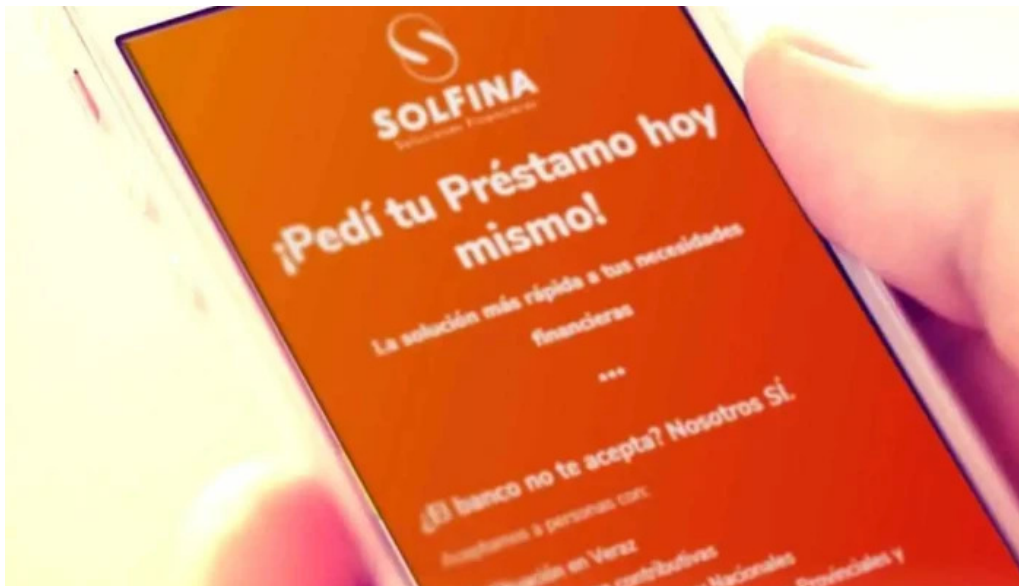
Solina soluciones financieras del propietario