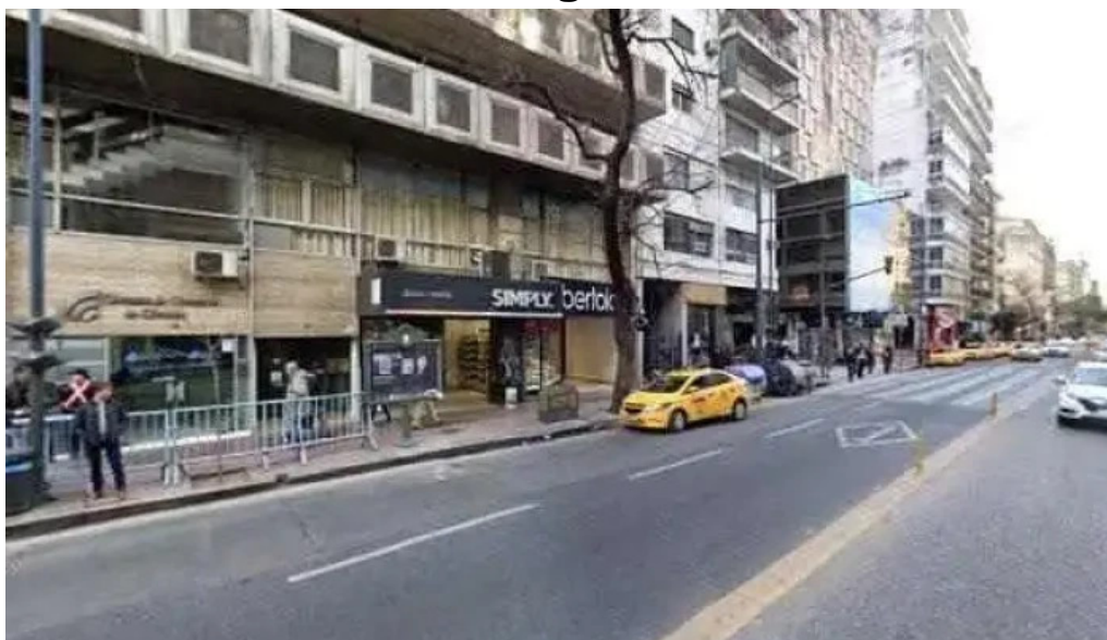
Solfina soluciones financieras numero