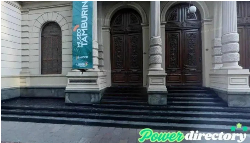
Solfina s a s cordoba