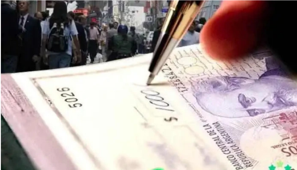
Solfina sas del propietario