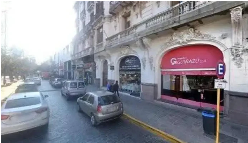
Hey credits direccion