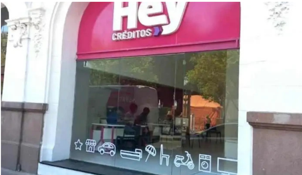
Hey credits cordoba