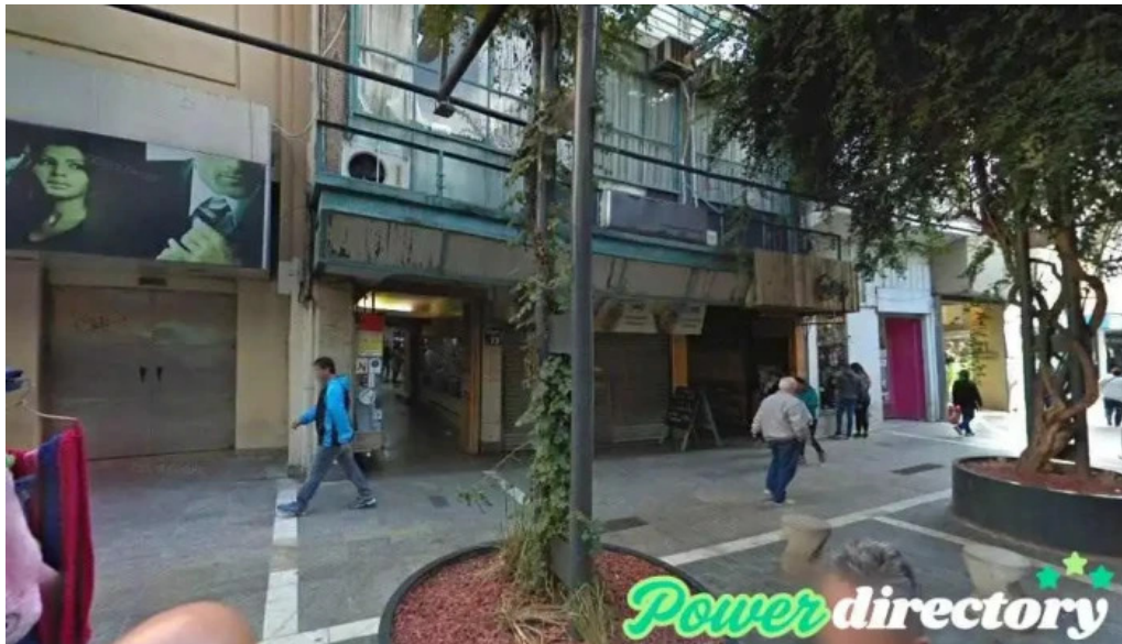
Grupo fortuna prestamos cordoba