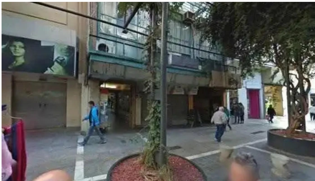
Grupo fortuna prestamos comentarios