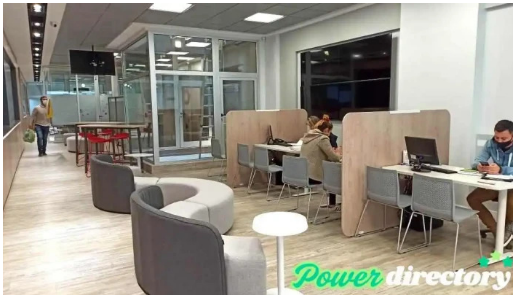
Don credito del propietario