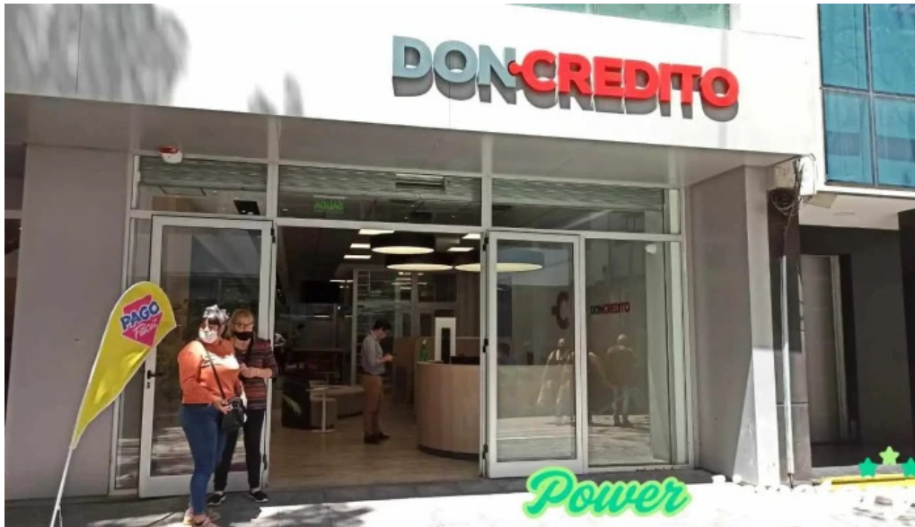
Don credito cordoba