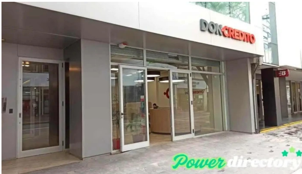
Don credito exterior