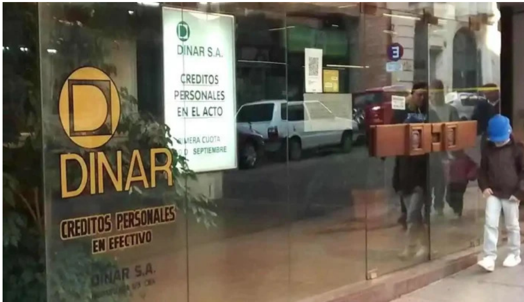
Dinar creditos personales exterior