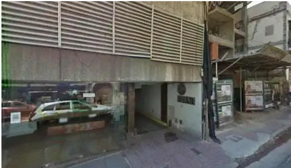
Dinar creditos personales descuentos