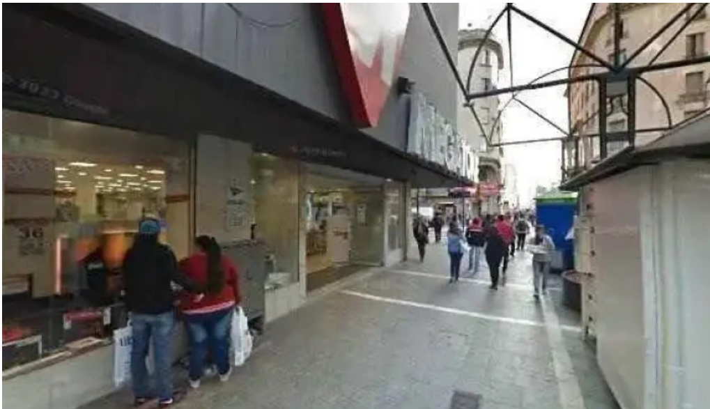
Creditos activos y jubilados horario