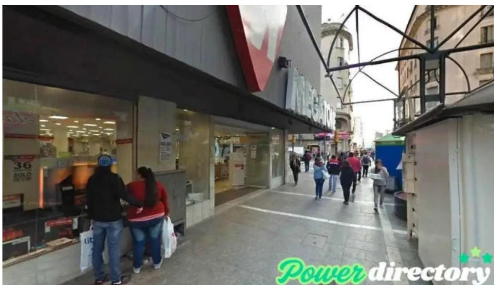
Creditos activos y jubilados cordoba