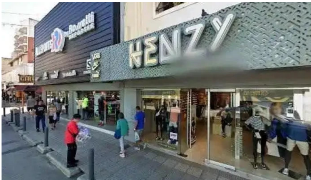
Credito argentino descuentos