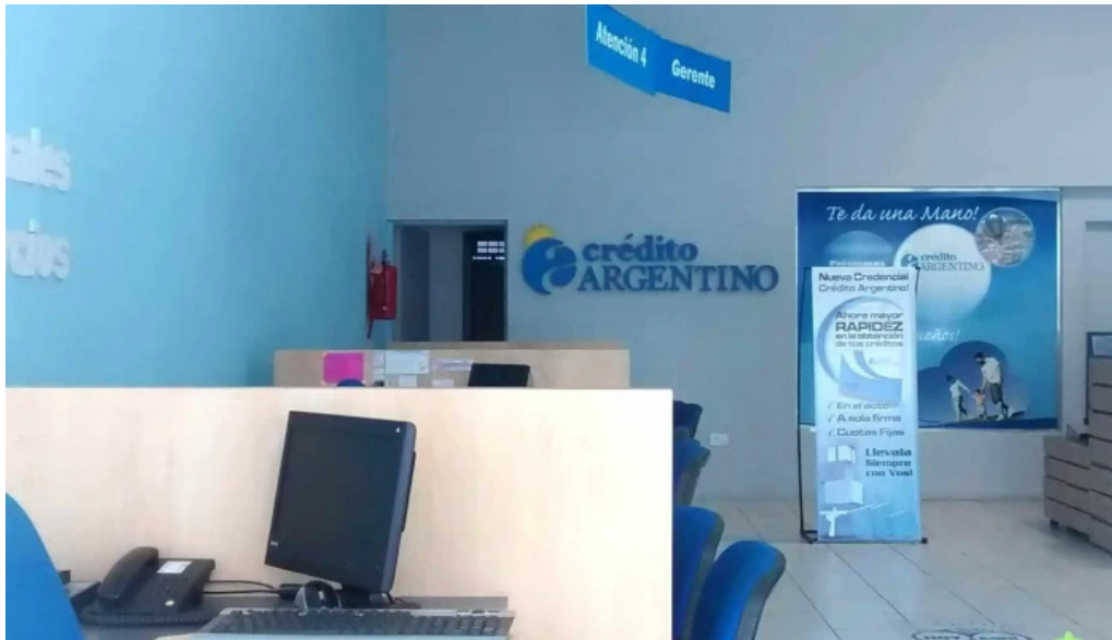
Credito argentino interior