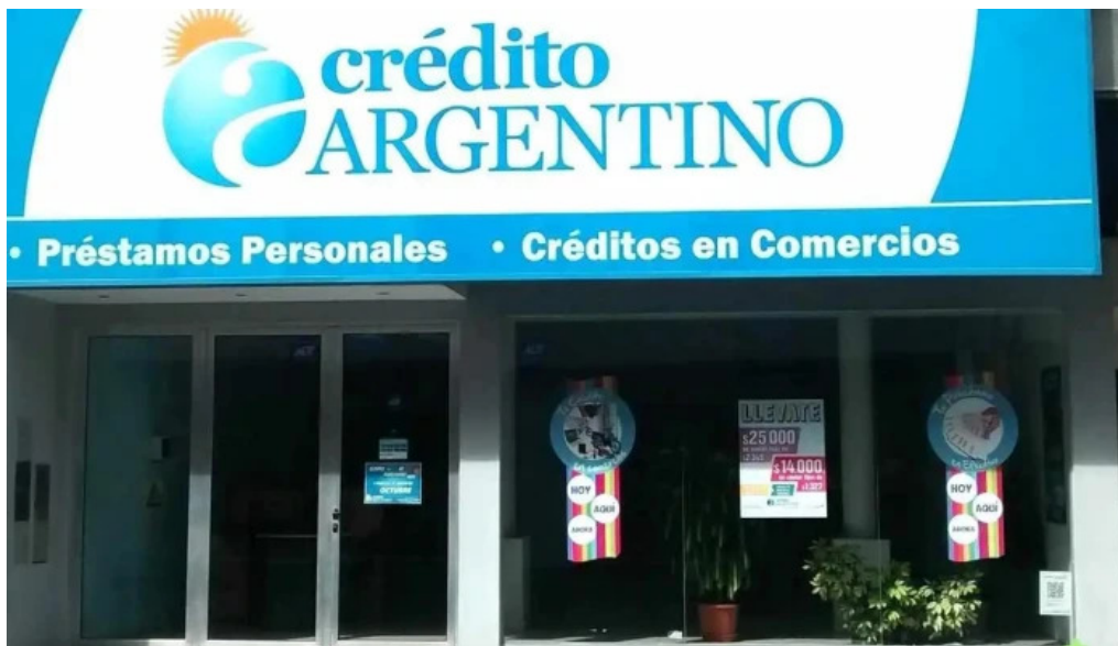
Credito argentino cordoba