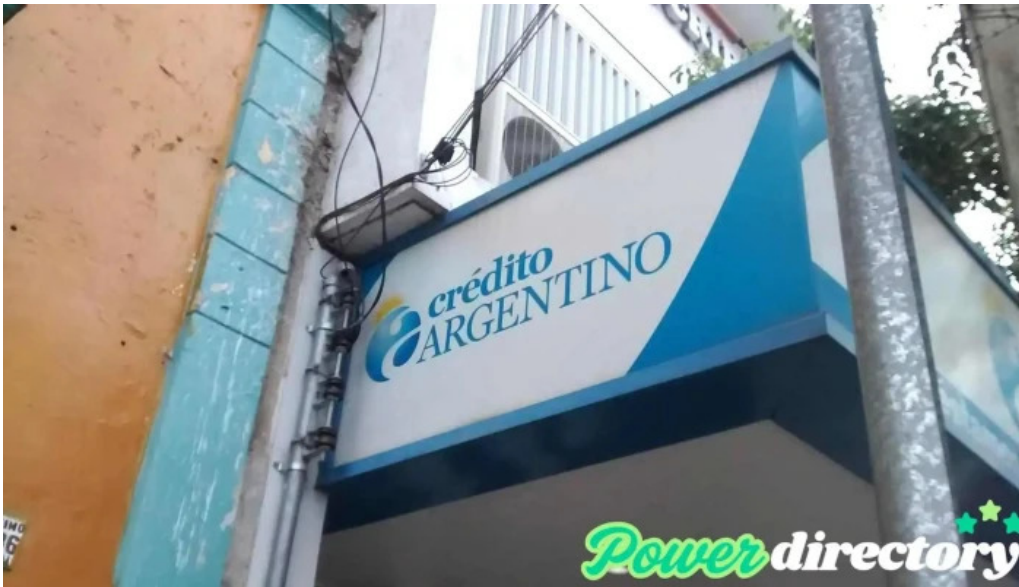
Credito argentino cordoba