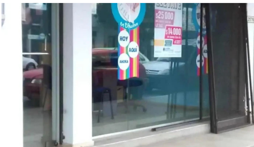
Credito argentino exterior