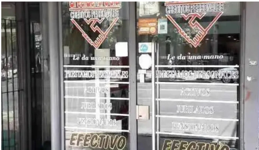
Credicentro sa cordoba