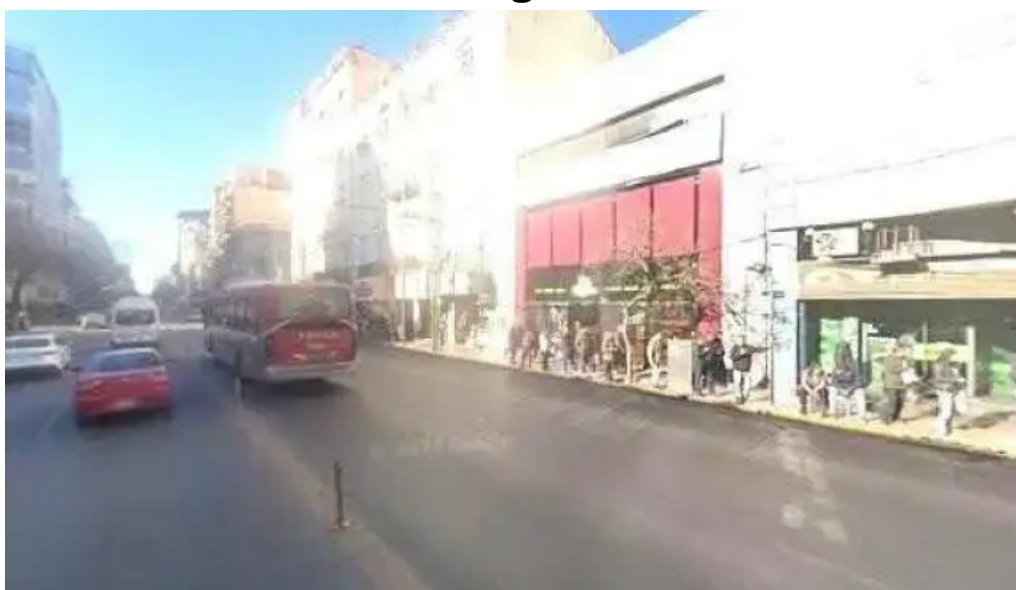
Credicentro sa promocion